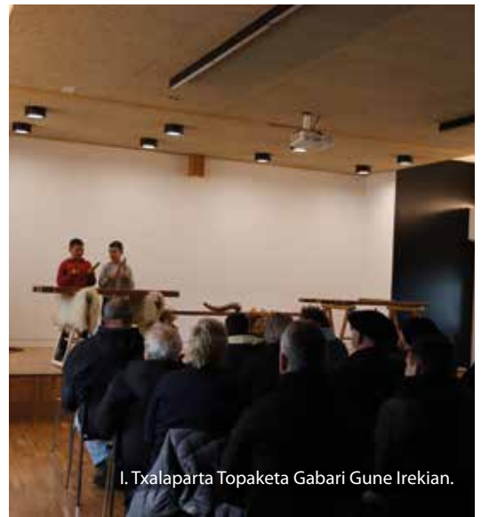
I. Txalaparta Topaketa Gabari Gune Irekian.