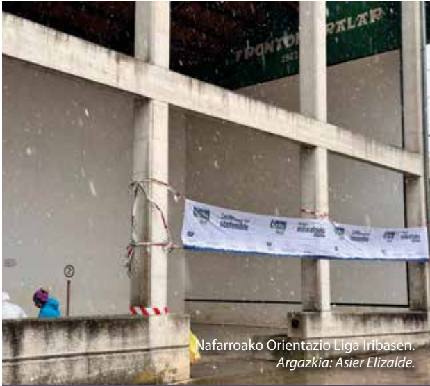
Nafarroako Orientazio Liga Iribasen.