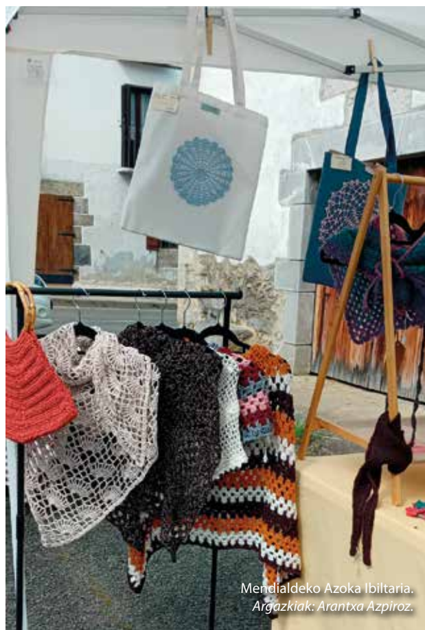
Mendialdeko Azoka Ibiltaria.

Azoka beste hainbat herritan ere egingo da: maiatzaren 17an Lekunberrin, ekainaren 28an Goldaritzen, irailaren 13an Leitzan eta urriaren 11n Areson. Ekimenak eskualdeko hainbat udalen lankidetzatza izan du, baita tokiko elkarte eta eragileen babesa ere.