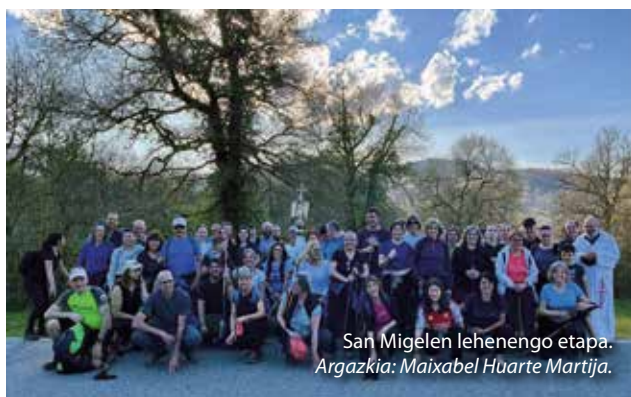
San Migelen lehenengo etapa.

Apirilaren 5ean, Pazko egunez, San Migel Goiaingerua Aralartik atera zen Baraibarrera bidean. Eguraldi bikainak lagunduta, hirurogei lagun inguru bildu ziren mendiz ibilaldia egiteko.