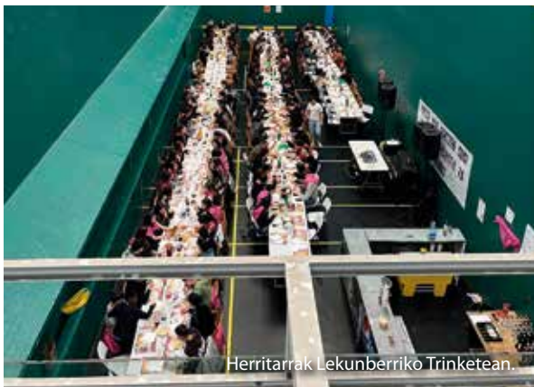
Herritarrek Lekunberriko Trinketeen.