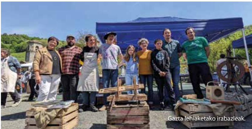
Gazta lehiaketako irabazleak.