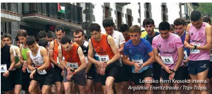
Leitzako Herri Krosako irteera.