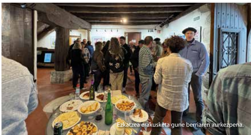
Ezkatzea erakusketa gune berriaren aurkezpena.