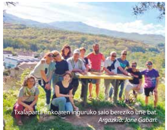
Txalaparta finkoaren inguruko saio bereziko une bat.