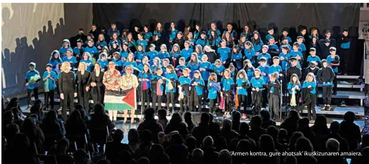
'Armen kontra, gure ahotsak' ikuskizunaren amaiera.

Ikuskizunak zirraraz betetako uneak eskaini zituen, eta bertaratutakoek txalo zaparrada beroekin eskertu zuten egindako lana.