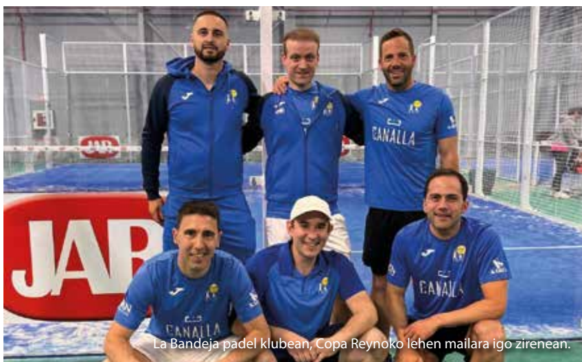
La Bandeja padel klubean, Copa Reynoko lehen mailara igo zirenean.

Batez ere pistak pixka bat egokitzea eta txapelketak antolatzea, mundu mailan