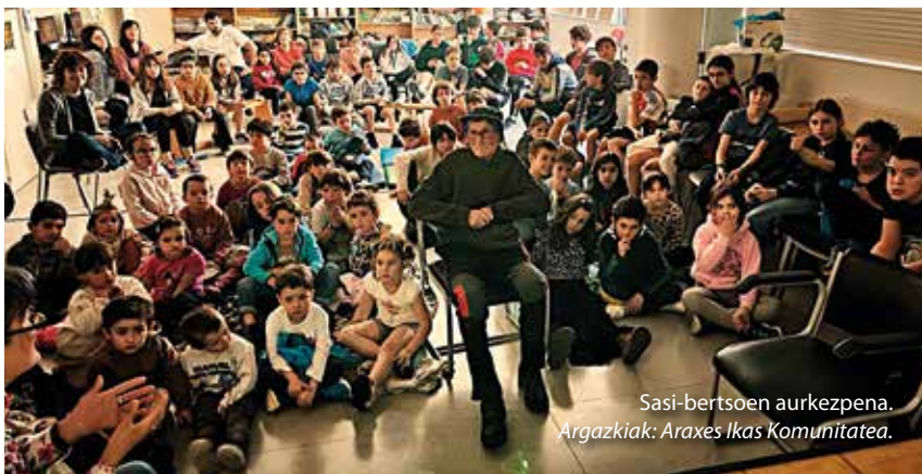
Sasi-bertsoen aurkezpena.

Gure "filosofoak" dioen bezala: "SENTITU, PENTSATU eta EKIN" eta urte askoan jarrai dezala bere lekukoak pausoz pauso, eskuz esku Korrikarekin!