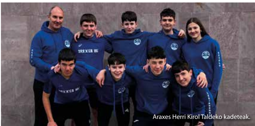
Araxes Herri Kirol Taldeko kadeteak.

*Entzun elkarrizketa osorik Aralar Irratian: https://labur.eus/prgspdnn