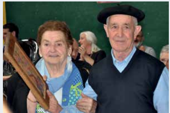
2014ko Larraungo Egunean omendua