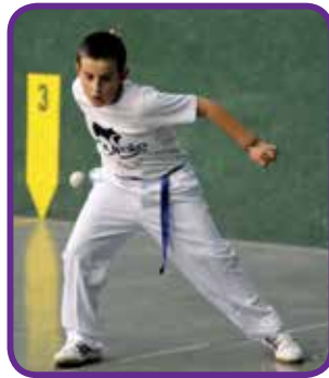
Intza Garaño Urtarrilak 24, 10 urte Zorionak txapeldun etxekoan partez. Muxu potolo bat.