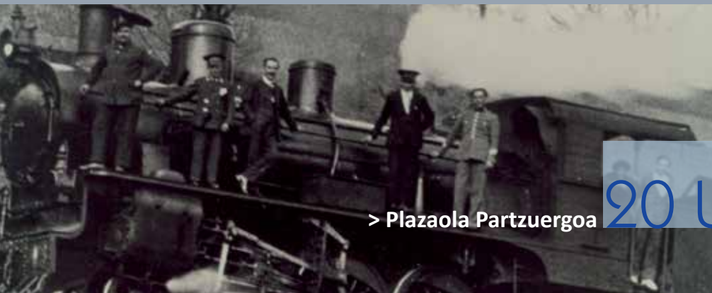
> Plazaola Partzuergoa