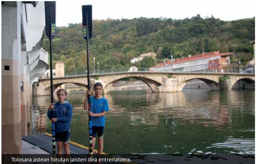
Tolosara astean hirutan jaisten dira entrenatzera.