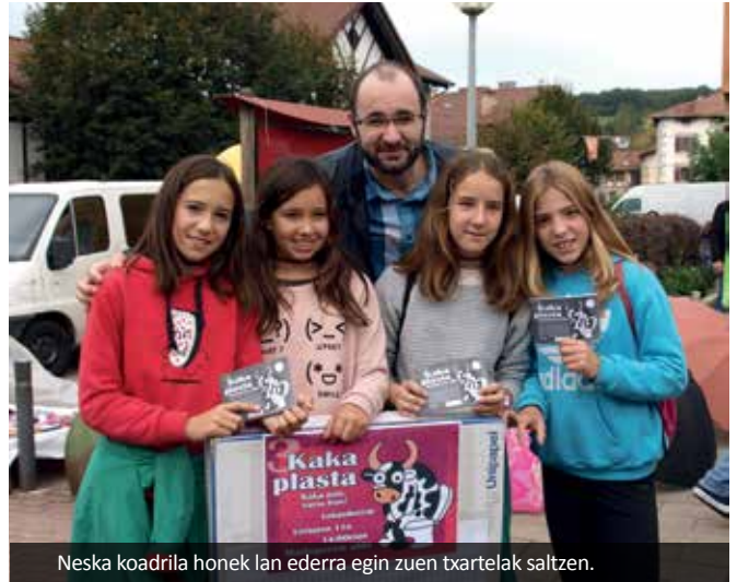
Neska koadrila honek lan ederra egin zuen txartelak saltzen.