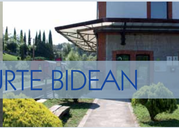
> Plazaola Partzuergoa