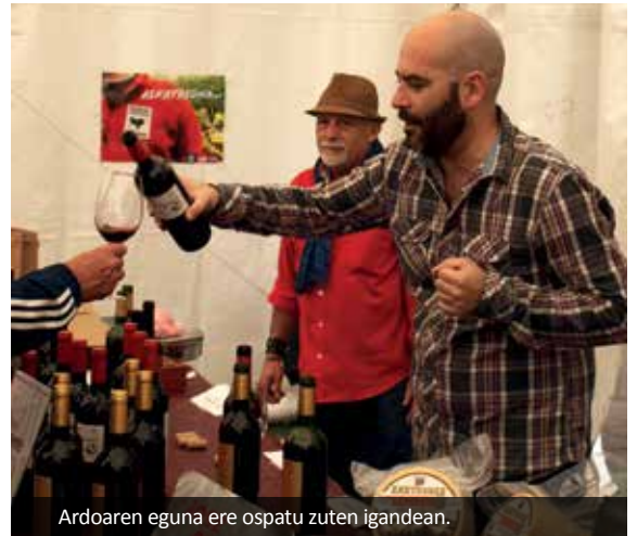
Ardoaren eguna ere ospatu zuten igandean.