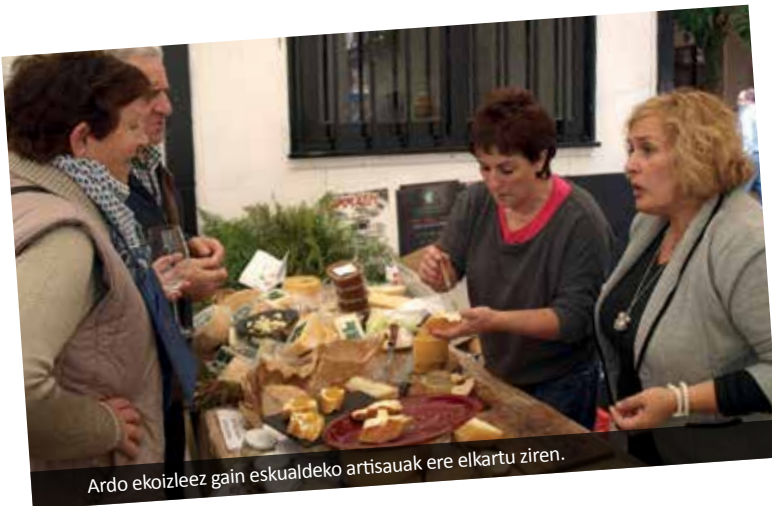
Ardo ekoizleez gain eskualdeko artisauak ere elkartu ziren.