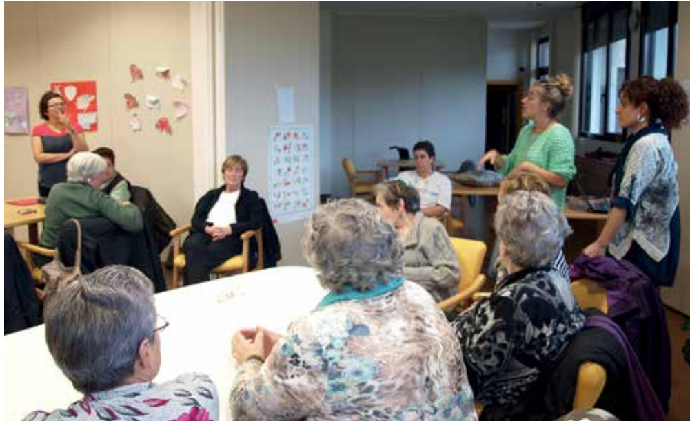
Alzheimerra eta parkinsona dira egungo gaixotasunik diagnostikatuenak hirugarren adinean.