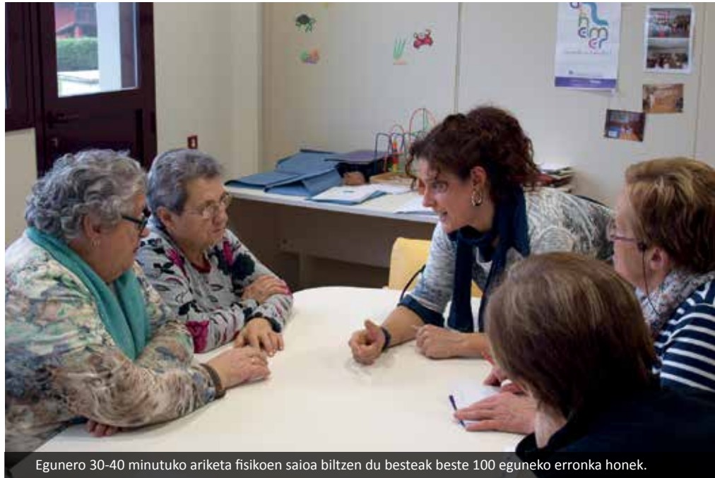
Egunero 30-40 minutuko ariketa fisikoen saioa biltzen du besteak beste 100 eguneko erronka honek.

Gaur egun ze gaixotasun mota dira ohikoenak adineko pertsonen artean? Alzheimerra da gaur egun gehien diag-