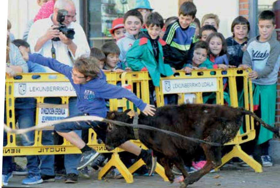
Haurren egunean beraiei zuzendutako jarduera ugari izan ziren.