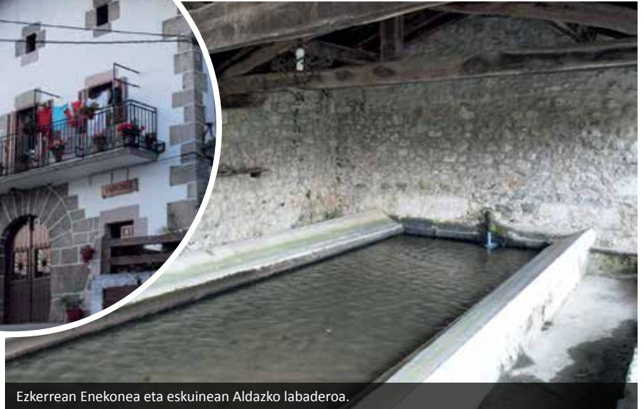
Ezkerrean Enekonea eta eskuinean Aldazko labaderoa.