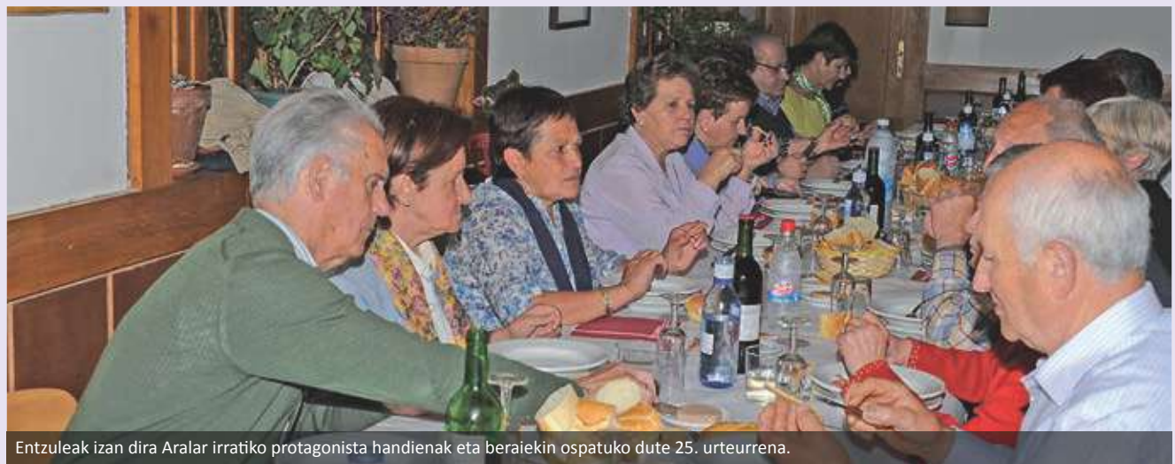
Entzuleak izan dira Aralar irratico protagonista handienak eta beraiekin ospatuko dute 25. urteurrena.