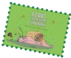
Denonartean Argitaletxeak eskainitako liburuak.