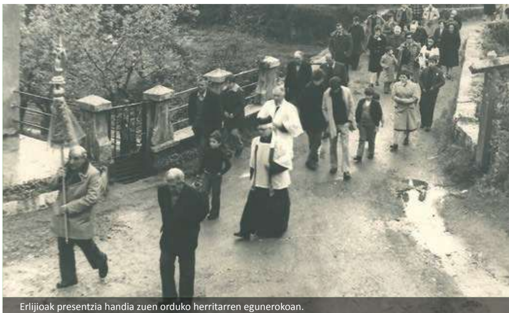
Erljiioak presentzia handia zuen orduko herritarren egunerokoan.

Zortzi bat. Holaxeko obi kozkor batzuk. Ta obi ona e!