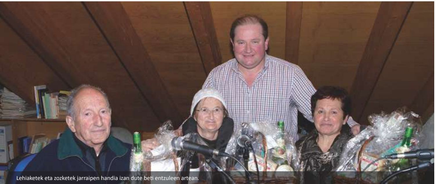
Lehiaketek eta zozketek jarraipen handia izan dute beti entzuleen artean.