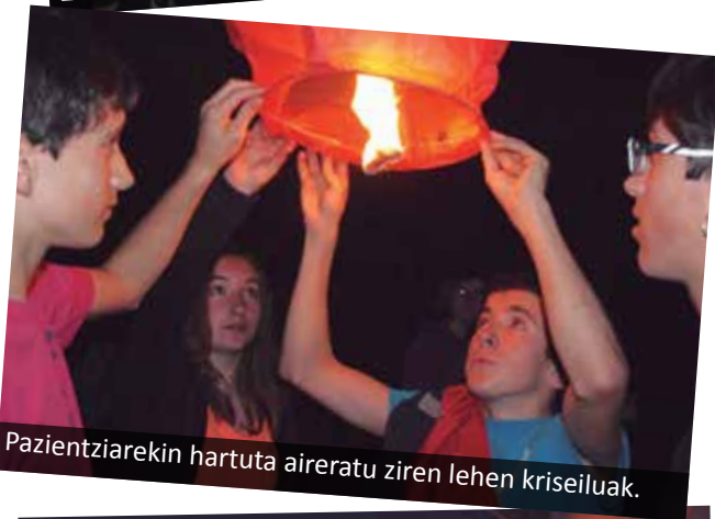
Pazientziarekin hartuta aireratu ziren lehen krisailuak.