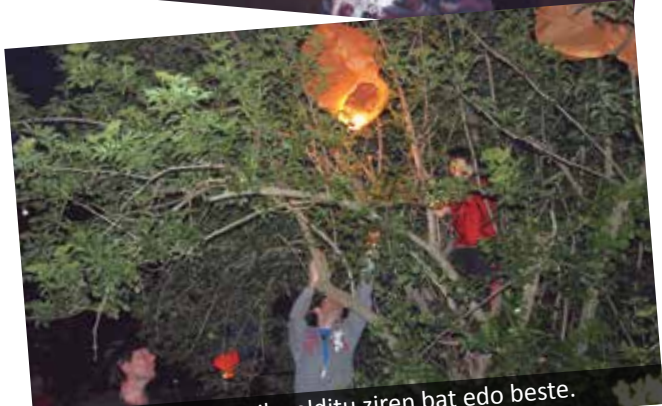
Zuhaitzean trabaturik gelditu ziren bat edo beste.