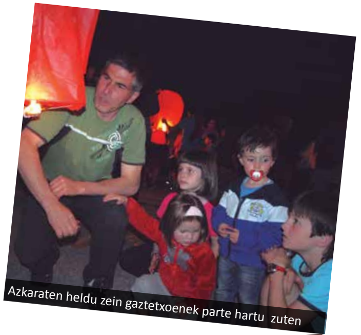
Azkaraten heldu zein gaztetxoek parte hartu zuten