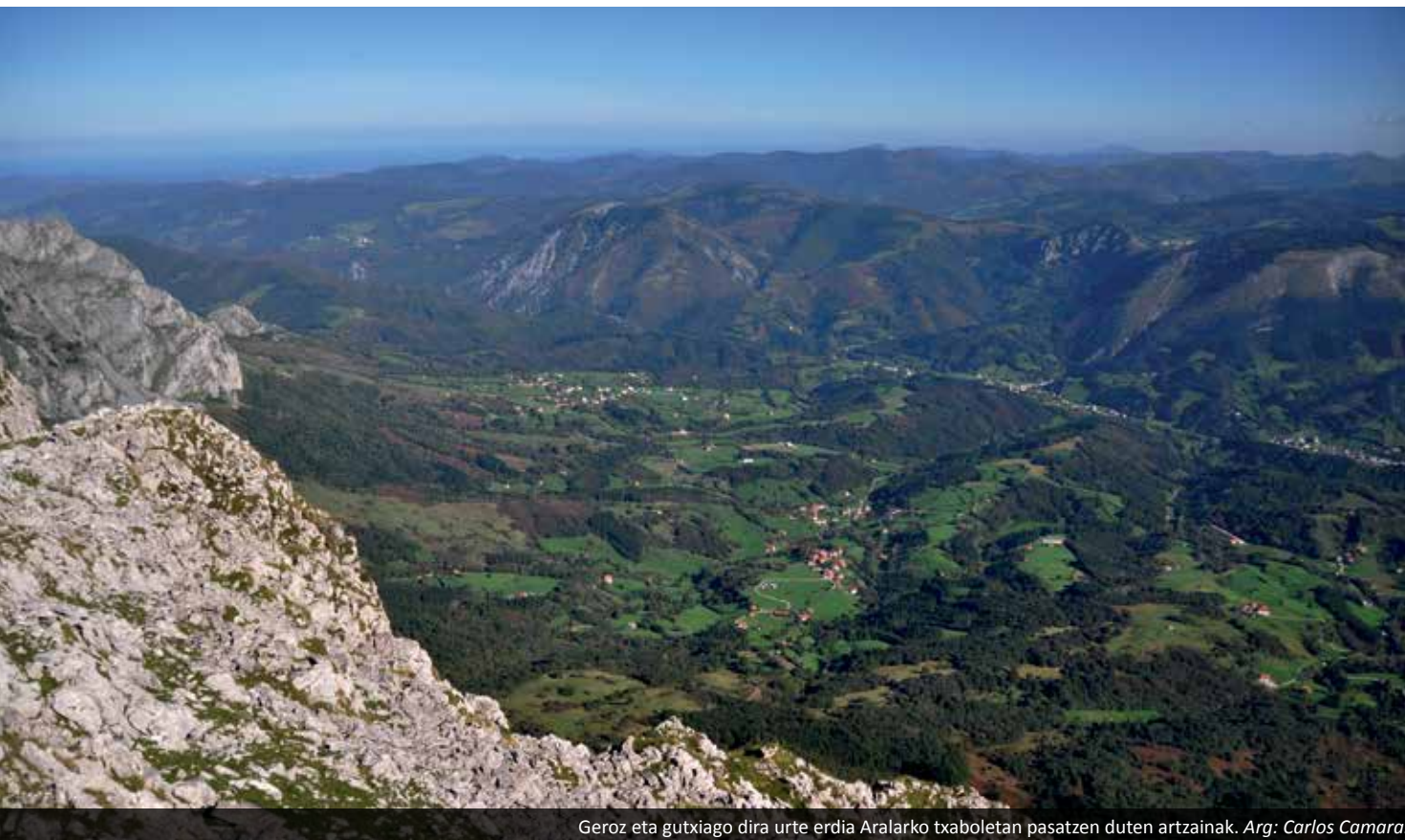
Geroz eta gutxiago dira urte erdia Aralarko txaboletan pasatzen duten artzainak.