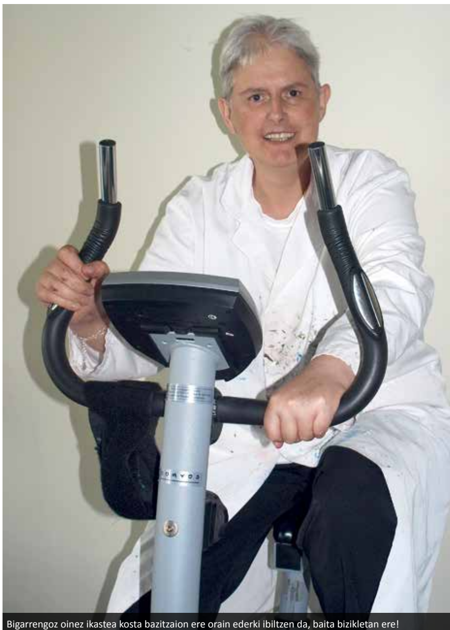
Bigarrenez oinez ikastea kosta bazitzaion ere orain ederki ibiltzen da, baita bizikletan ere!

Goizeko zortzi terdik aldea esnatu, du-txatu, gosalduta ta geo batzutan daukeu fisioakin eon beharra, logopedakin, bizikleta estatikoan ibiltzen... Da geo bazkaldu ta atsalden telebisioa ikusten eon o siesta in ta ondoren eskulanak eitten dittu. Ni txapak eitten aitzen naiz.