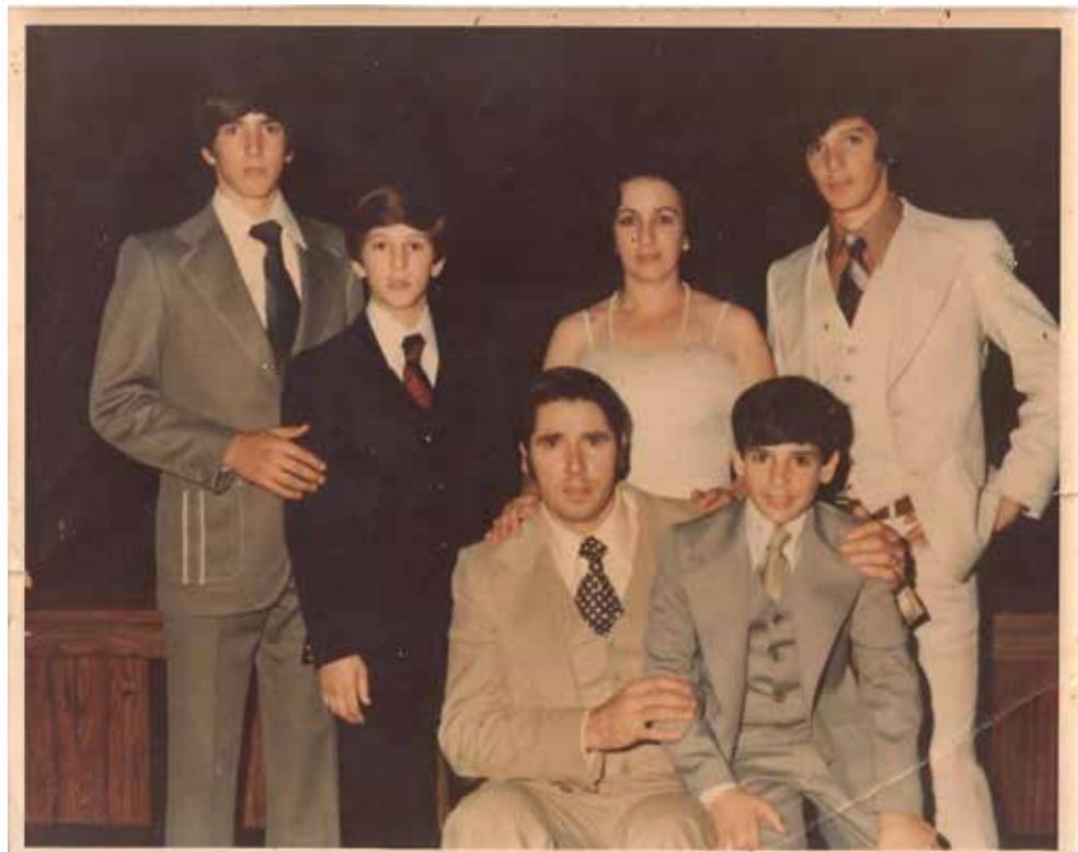
Riki bere hiru anaiaekin eta gurasoekin.

Bai. Txikitatik etorri izan gara hona. Haurtzaroko oroitzapen politik dauzkat, errekan amuarrainak hartzen genituenekoak etab. Herriko semeak