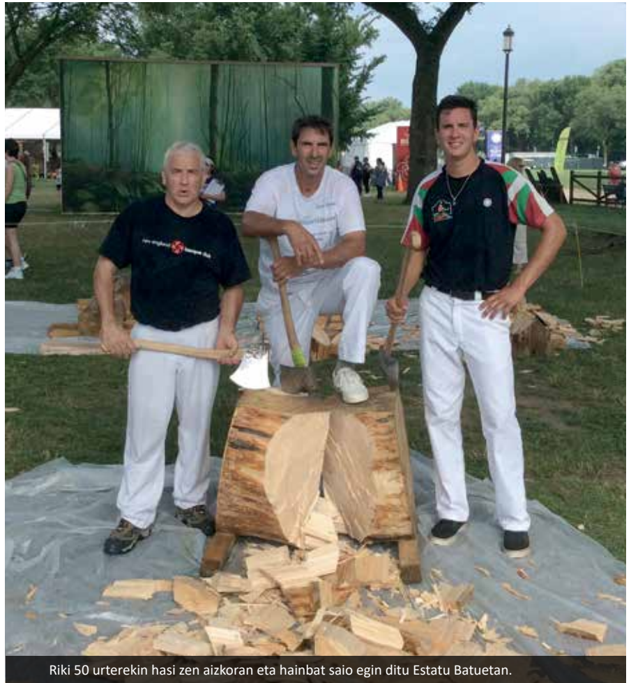
Riki 50 urterekin hasi zen aizkoran eta hainbat saio egin ditu Estatu Batuetan.

Bi greba bizi izan ditugu. Lehena nire aitaren garaian, 1968an, greba horren ondotik aitak jokatzeari utzi zion. Eta