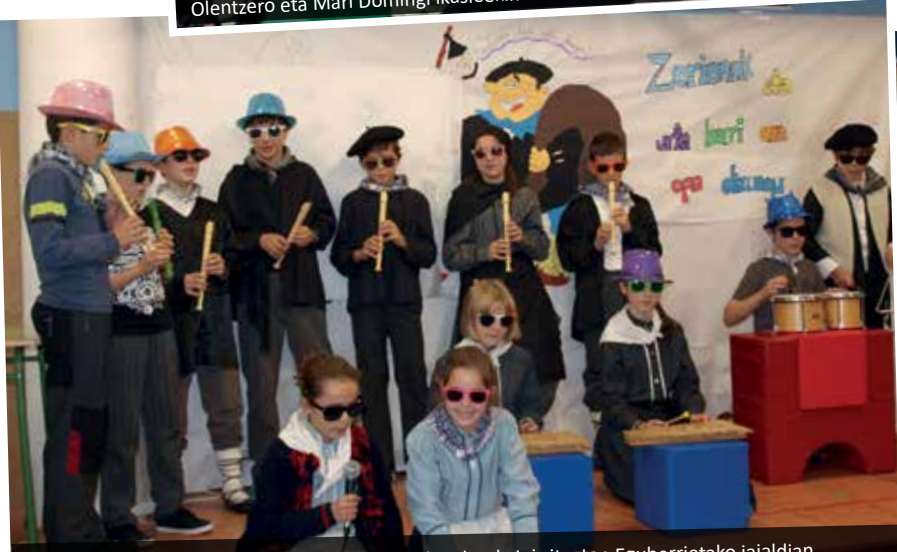
Araxes ikastetxeko ikasleek abestiak eta antzezlanak eskaini zituzten Eguberrietako jaialdian.