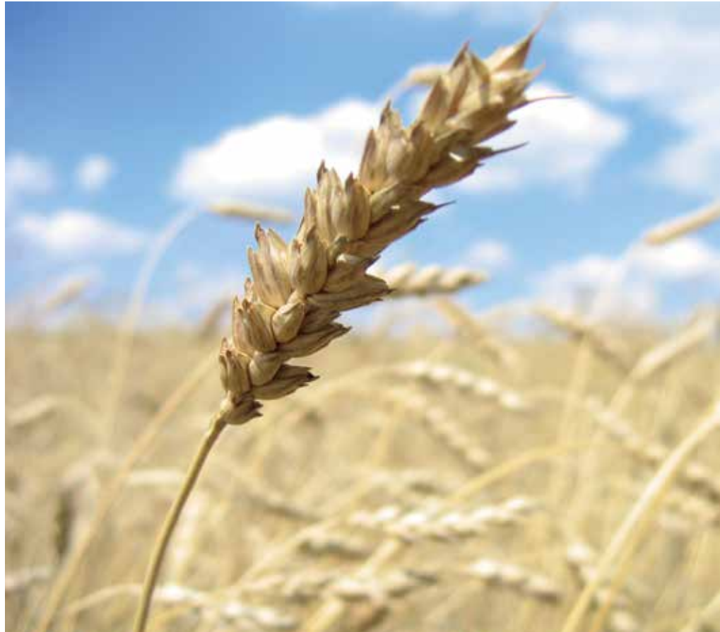
Zerealak fintzen direnean propietate asko galtzen dituzte.