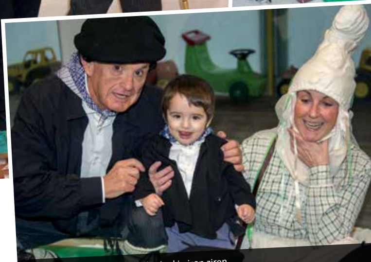
Olentzero eta Mari Domingi ikasleekin izan ziren.