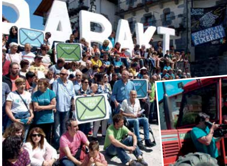
Leitzan E18ko galderak aurkeztu zituzten eta giroa berotzen joateko aurki izanen da kalean herriz herri grabatutako bideoak.

Bestalde, ekimenetik abesti bat ere sortu dute giroa berotzen joateko. La Jodedera taldeak sortu du abestia eta Oskar Estangak jarri dizkio hitzak. Eskualdeko musikari, abeslari eta musika ekizleek parte hartu dute. Gainera, eskualdeko lau udalek ekimenari babesa adierazten dion mozioa onartu berri dute.