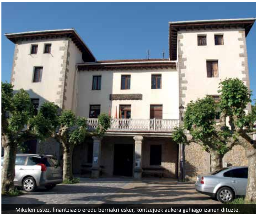
Mikelen ustez, finantziazio eredu berriakri esker, kontzejuak aukera gehiago izanen dituzte.

Bai. Finantzatzeko modua ere aldatu egingo da. Orain arte, ate bat jo eta politikaria konbentzitu gero lortzen zifun. Finantziazio eredia zaharkiturik dao eta bizio asko dao. Oso diru-ekarpen murrizta ematen zaie udalerriei eta gainontzekoa diru-laguntzen bitartez banatzen da. Herrian frontoi bat itteko adibidez, udal edo kontzeju askok ez due inoiz diru sarreraik horretarako, Nafarroako Gobernuak ez dizu ematen, beño mo-