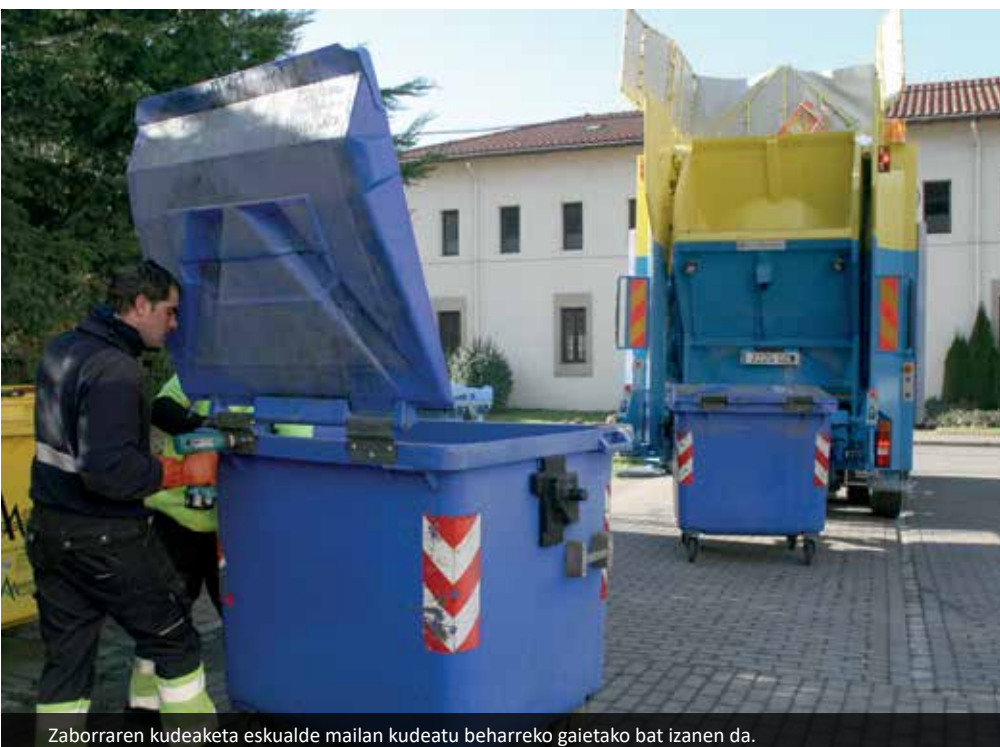
Zaborraren kudeaketa eskualde mailan kudeatu beharreko gaitako bat izanen da.

Gauze asko eskualde mailan kudeatuko die. Arazo bat baldin badaukezu, zuzenen eskualdera jo beharko duzu. Dena den ez da asmoa dena leku baten zen-