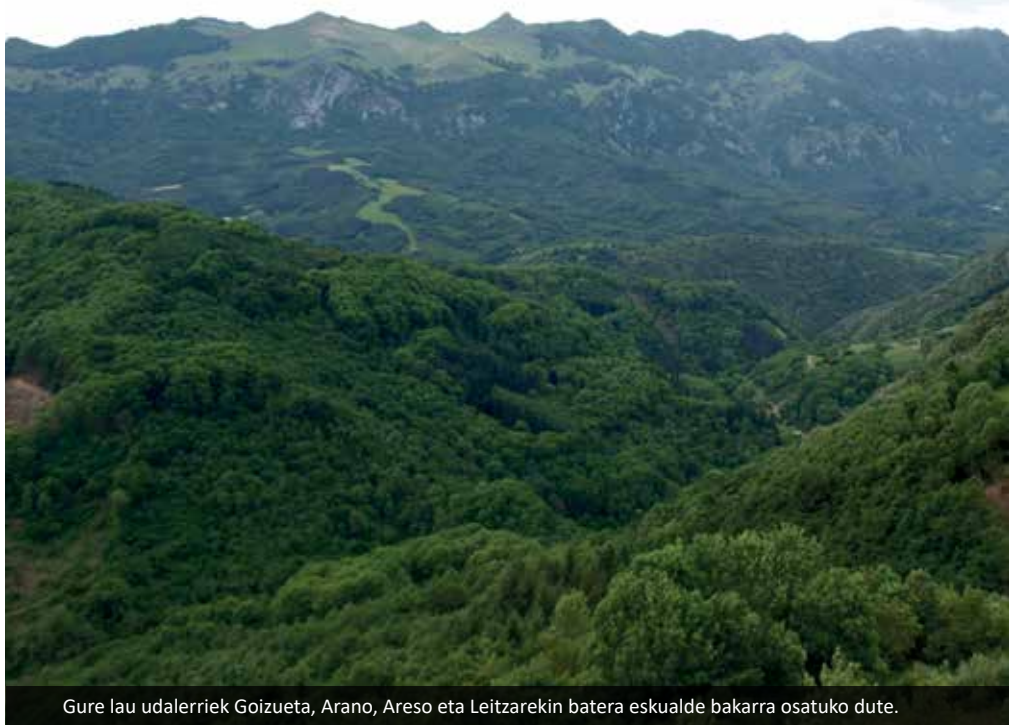
Gure lau udalerriek Goizueta, Arano, Areso eta Leitzarekin batera eskualde bakarra osatuko dute.

Tokiko maparen banaketak nola behar zuen, zein zen banaketa egokiena, entitate bakoitzek ze eskumen euki beharko lituzkeen, zer eon beharko lukeen kontzejun eskutan, zer udalan eskutan eta zer mankomunitateen eskutan. Oaindik ez dao guztiz argi, mankomunitateek udalen menpe eongo ote diren edo euren politika propioa izanen duten. Hala ere, mankomunitate bakoitzek izain do dagokion lurraldeko eskumen batzuk, uraren goi-hornidura, gizarte zerbitzuak etab. Erreforma indarrean sartzen bada, mankomunitateak dagokion lurralde eremura egokitu beharko dira, adibidez Larraun ez datteke eon Saka-