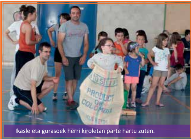
Ikasle eta gurasoek herri kiroletan parte hartu zuten.