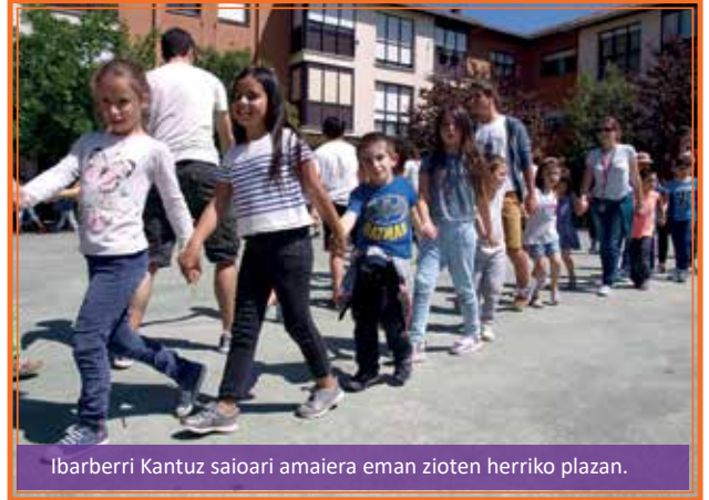
Ibarberri Kantuz saioari amaiera eman zioten herriko plazan.