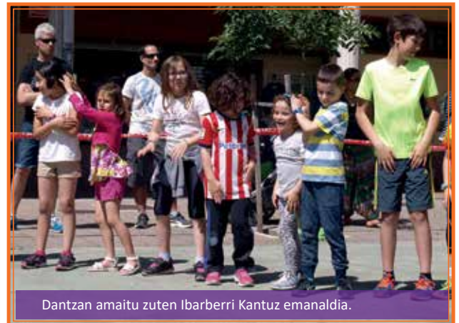
Dantzan amaitu zuten Ibarberri Kantuz emanaldia.