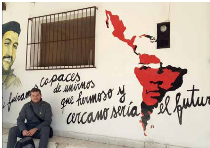
Bolivian, Che Guevara hil zuten herrian, izan da Mikel Betelu.

Aldaketa iritsi aurretik inperialismoak (AEB, FMI, Europar Batasuna,...) kontrolatutako gobernuak zeuden, kolonialismo ekonomiko-kulturala pairatzen zuten boliviarrak eta egoera oso txarra zen, arrazismo eta ustelkeria handia zegoen. Aldaketa egitearekin aurrerapausoak eman dira eremu ezberdinetan, baina ez da