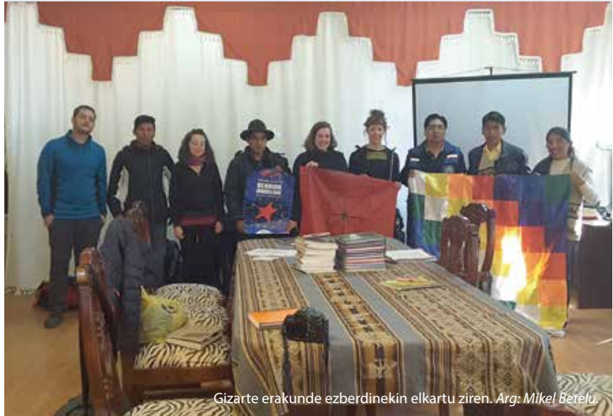
Gizarte erakunde ezberdinekin elkartu ziren.

Nire ustez beraien herriaren behar eta nahietara egokitutako sistema politiko-ekonomiko-kultural eta soziala eraikitzeko erronkan sakondu behar dute. Bizitza emakumearen,