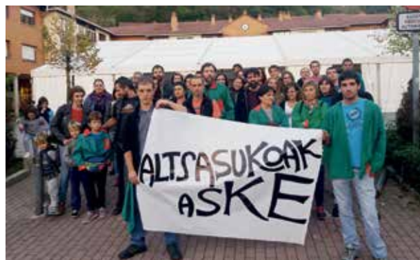
Larraungo Elkartasun Taldea

Larraungo elkartasun taldekook, Lekunberriko pesten hasieran elkarretaratzea egin genuen Altsasuko gazteei eta herriari elkartasuna adierazteko. Orain urtebete izandako gertaerak eta hauek hartu duten bilakaerarengatik, hamarnaka herritar bildu ginen Altsasuko herriaren kontrako kriminalizazio saiakera eta estatuko fiskaltzatik egindako eskaera neurrigabeak salatzen (62 urte eta 6 hilabeteko eskaera gazteetako batentzat, 50 urte sei gazterentzat eta 12 urte eta 6 hilabete zortzigarrenentzat). Gaur egun gizartearen gehiengoa bizikidetzaren demokratikoa eta normalizazio politikoaz gozatzeko eskubidearen alde dagoela uste dugu. Eta lanean jarraituko dugu bakea, demokrazia, elkarbizitza, justizia eta pertsona guztien giza eskubideen errespetuagatik.