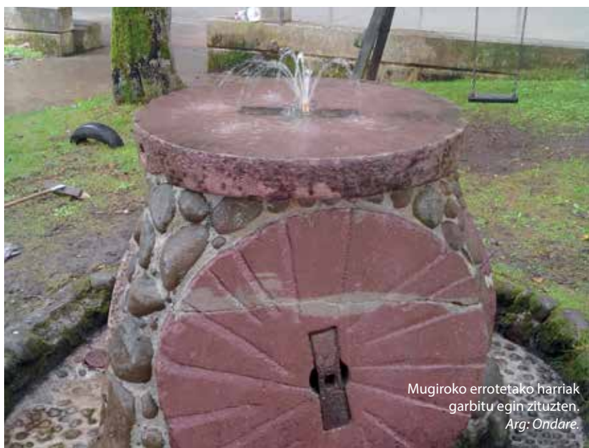
Mugiroko errotetako harriak garbitu egin zituzten.