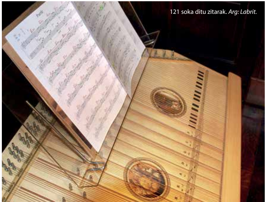
121 soka ditu zitarak.