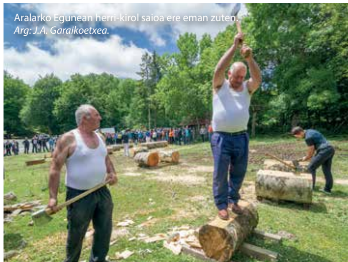
Aralarko Egunean herri-kirol saioa ere eman zuten.

Bai. Aralar Elkartetik aurrekontu txiki batekin eraberritzeko proiektu bat aurkeztu zen, baina ez zuten onartu eta guardetxea bota eta bere horretan utzi zuten. Horrekin batera, eraikin berria egiteko 206 zuhaitz