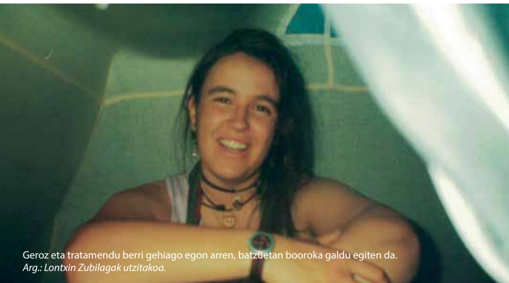
Geroz eta tratamendu berri gehiago egon arren, batzuetan booroka galdu egiten da.

rik esaten. Momentu hura aprobetxatu eta inguruan zebilen mediku gazte bat geldiarazi, historiala erakutsi eta zuzenean galdetu nion: -Honek zer esan nahi du? Badakit larria dela, baina zenbat denbora?-. Sei hilabeteko bizi itxaropena izan zezakeela erantzun zidan. Paperak bildu eta Olentzeroren jaialdira! Nik ez nion ezer kontatu, baina biok oso kontziente ginen egoeraz”.