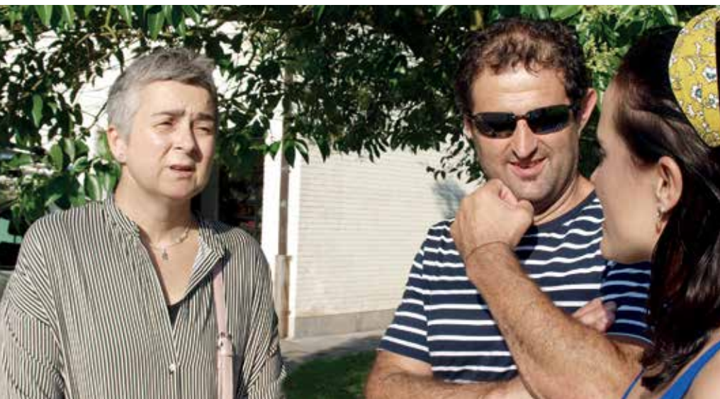
Minbiziaren gaia gizarteratzeko beharra dagoela uste dute hirurek.

harririk. Muin-emailek boluntarioki egiten dute eta uste dut muin-emaile gisa zure zelulek norbaiti lagundu diotela jakitea dela pozik handiena”.