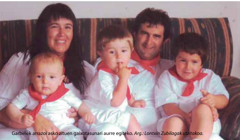
Garbiñek arrazoi asko zituen gaixotasunari aurre egiteko.