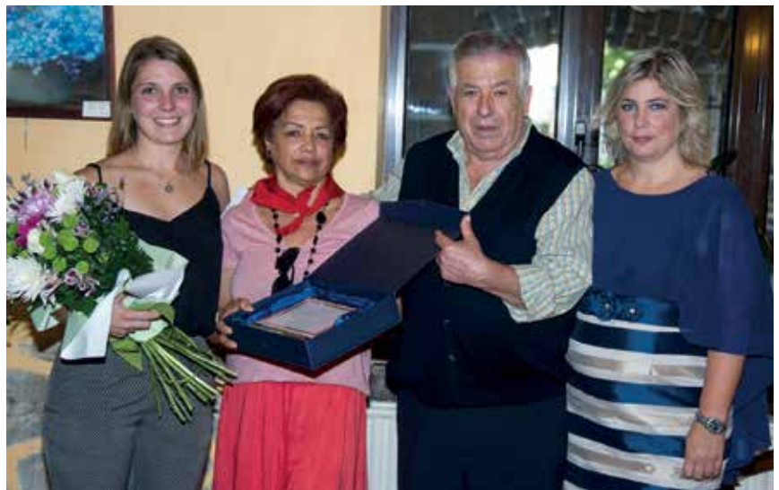
lazko Lekunberriko Pilarika jaietan egindako omenaldian.

Orain oso bizitza lasaia daramat. Nahi dudana egiten dut, inori baimezik eskatu gabe. Goizetan kiroldegira joaten naiz igeri egitera eta eguerdian etxera etorri bazkaria prestatu eta arratsaldean Sua, nire txakurra paseatzen dut. Anai-arrebak bisitatzerako joaten naiz noizean behin Estatu Batuetara. Bi biloba ere baditut, Enzo eta Irati eta horietaz ere gehiago gozatzeko tarteak ditut orain. Egia da batzuetan bakarrik ere sentitzen naizela, tabernan beti jende artean ibili izan naizelako eta batzuetan saltsa hori faltan somatzen dut. Jende asko ezagutu dut Jubilatuetan. Jubilatutaldea asko etortzen ziren bazkaltzera kanpotik ere. Eta asteburuetan umez beteta izaten nuen taberna. Ilaran jartzen ziren goxokiak erosteko. Eta orain berriz, horietako asko eta asko dagoeneko euren seme-alabekin ikusten ditut. Faltan botatzen dut, baina, pozik nago.