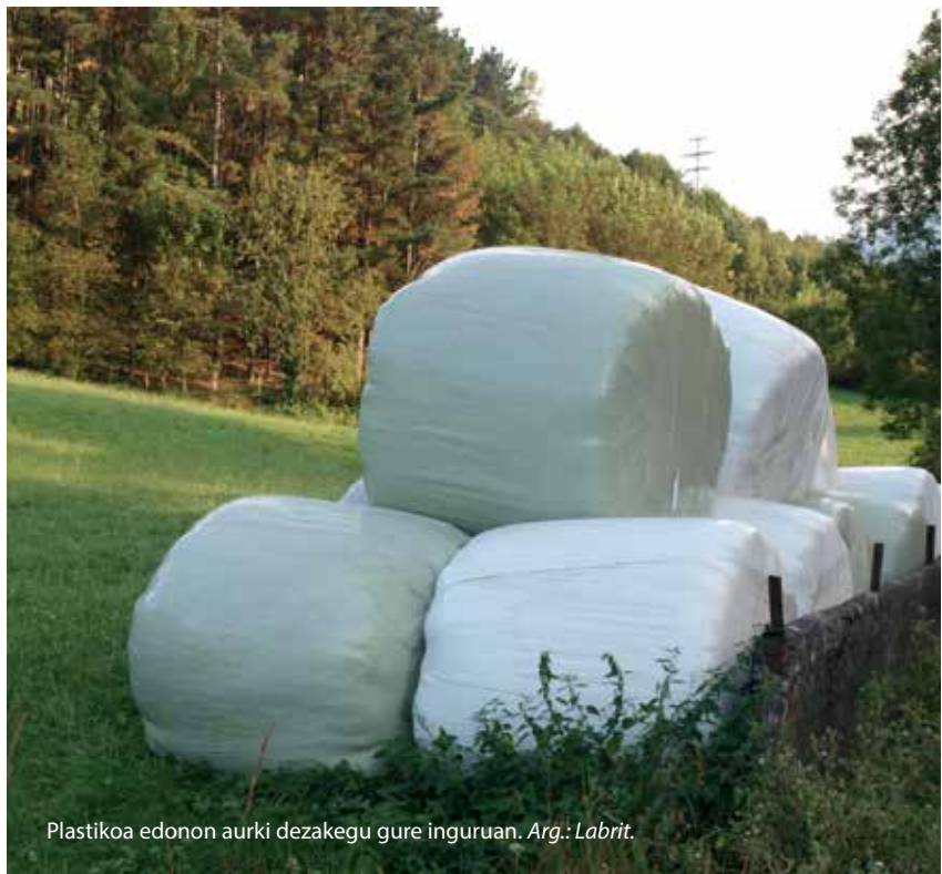
Plastikoa edonon aurki dezakegu gure inguruan.

Eta pankartak? Zenbat pankarta jartzen dira gure eskualdean urte baten buruan? Denak plastikozkoak, eta gehienak ez dira berrerabiltzen. Dagoeneko zenbait herritar gaiarekiko sentsibilizatzen hasiak dira. Urko