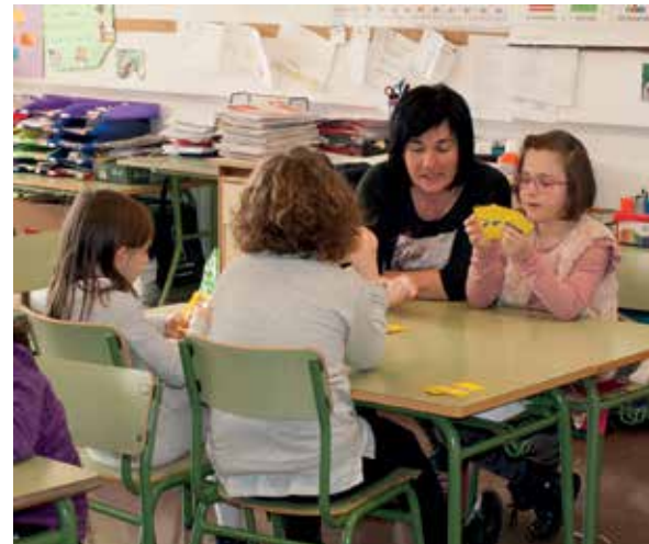
Boluntario bakoitzari ariketa bat egokitzen zaio saio bakoitzeko.

Iñigo: Gainera, batzuetan, garrantzitsuena erabaki duten hori