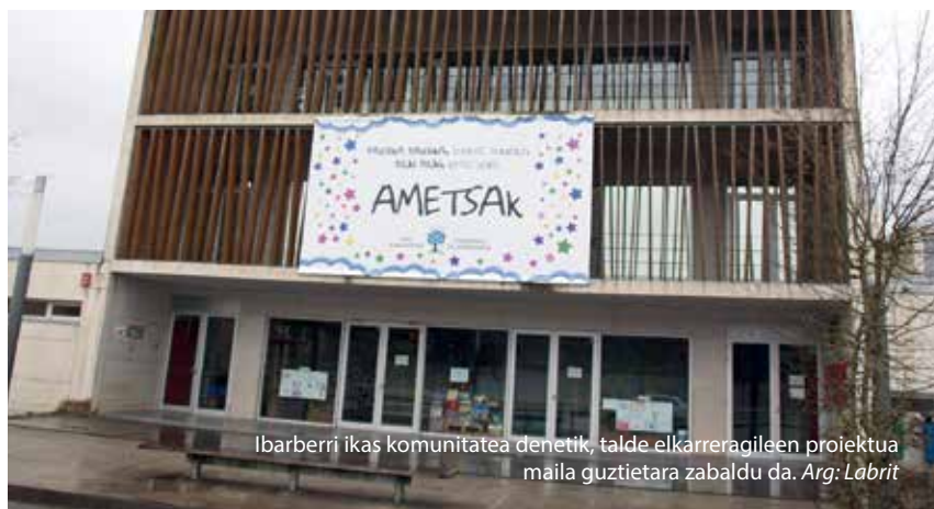
Ibarberri ikas komunitatea denetik, talde elkarrengileen proiektua maila guztietara zabaldu da.

“Gehiago kontzentratzen dira eta saio arrunt batean baino lan gehiago egiten dute”