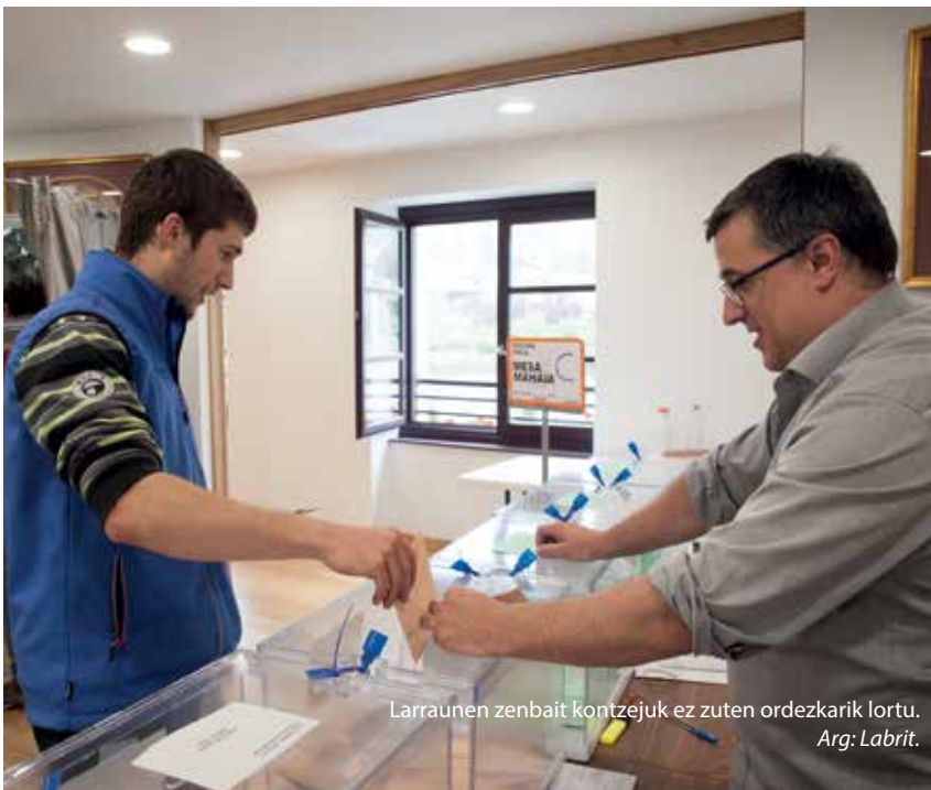
Larraunen zenbait kontzejuk ez zuten ordezkari lortu.

Hautagaiak hauteskunde kanpaina honetan lan handia egin dute eta herritarrengandik jasotako erantzuna ere halakoa izan da. Horregatik Mailoperen bitartez eskerrak eman nahi dizkie herritarrei bai Lekunberriko Taldeak eta baita Lekunberri eta Larraungo EH Bilduk ere.