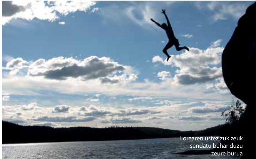
Lorearen ustez zuk zeuk sendatu behar duzu zeure burua

Ez dut uste gaur egun lehen baino gehiago dagoenik, baina gehiago ikusten da eta hori positiboa da, informazio gehiago dagoelako eta ondorioz, laguntza gehiago eskatzen delako. Hala ere, bide luzea dago oraindik lantzeko, adibidez genero bortizkeriaren arloan. Aldiz, ikastetxeetan kontzientzia gehiago dago bullying kasuekin, gero eta protokolo gehiago jartzen dira martxan hau ekiditeko edo honi aurre egiteko. Beste alde batetik, umeak etxean ikusten dutena jarraitzen dute normalean, hori garbi ikusi nuen Ilundaineko CEA (Arangurengo Heziketa Zentroa) instituzioan, non, delituak egin dituzten adingabeak dauden. Askok familia desegituratuetatik datoz, non gurasoek ez dituzten aski baliabide ekonomiko, edo bizitza trapitxeo eta lapurretak egiten ateratzen duten aurrera. Askok patroiz bera jarraitzen zuten. Beste askok droga kontuetan sartuta daude, horrek eragin dezakeen jarrerekin.