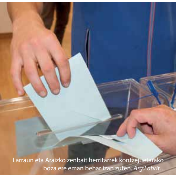
Larraun eta Araizko zenbait herritarrek kontzejuetarako boza ere eman behar izan zuten.

Udalek ekainaren 15era arte izanen dute udal aldaketa egiteko epea. Nafarroako Parlamentuan epe luzeagoa izanen dute eta ikusteko dago datozen asteetan alderdiek euren artean adostutako akordioaren behin-betiko emaitza zein izanen den.