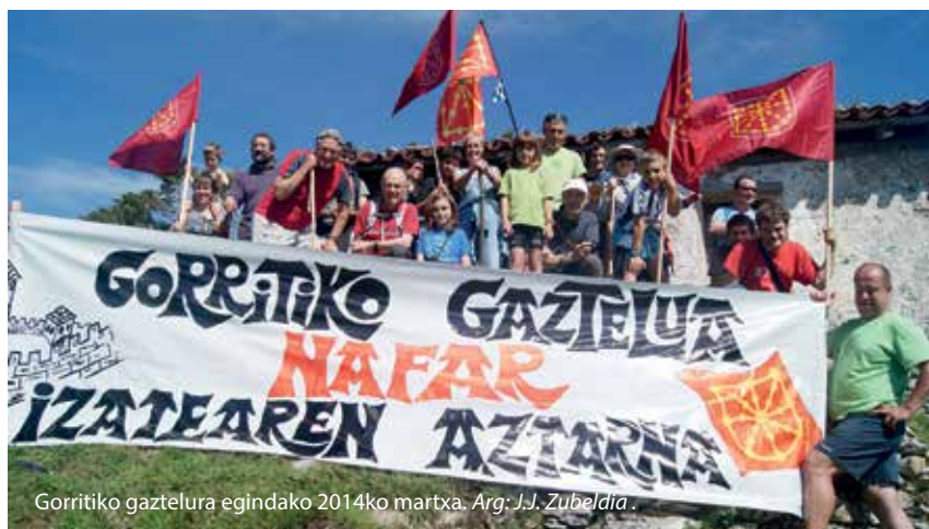
Gorritiko gaztelura egindako 2014ko martxa.

Bien bitartean, Larraunen eta batez ere Gorritin garbiketa lanekin