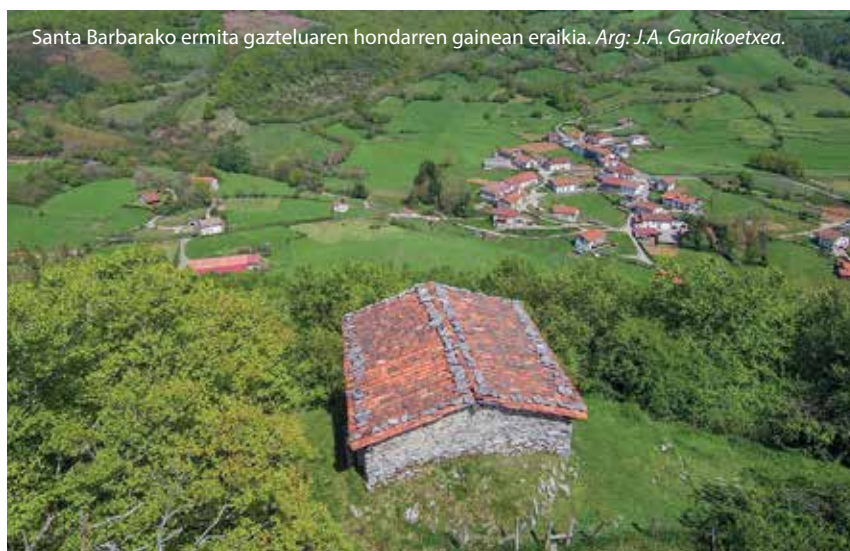
Santa Barbarako ermita gazteluaren hondarren gainean eraikia.