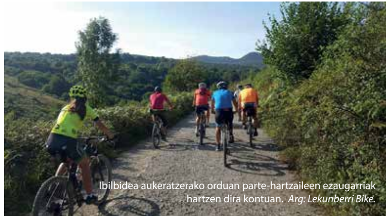
Ibilbidea aukeratzeko orduan parte-hartzaileen ezaugarriak hartzen dira kontuan.

Informazio gehiago: lekunberribike@yahoo.com