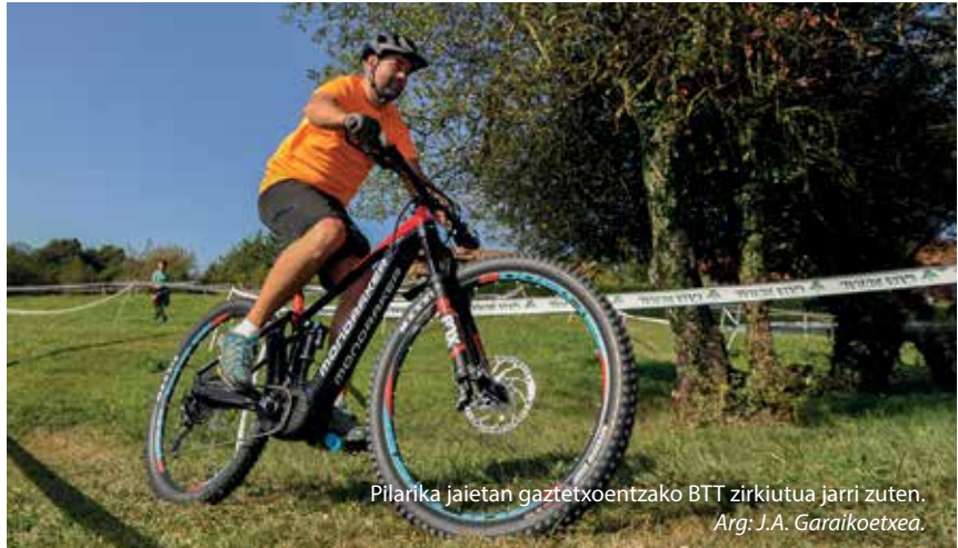
Pilarika jaietan gaztetxoentzako BTT zirkiutua jarri zuten.