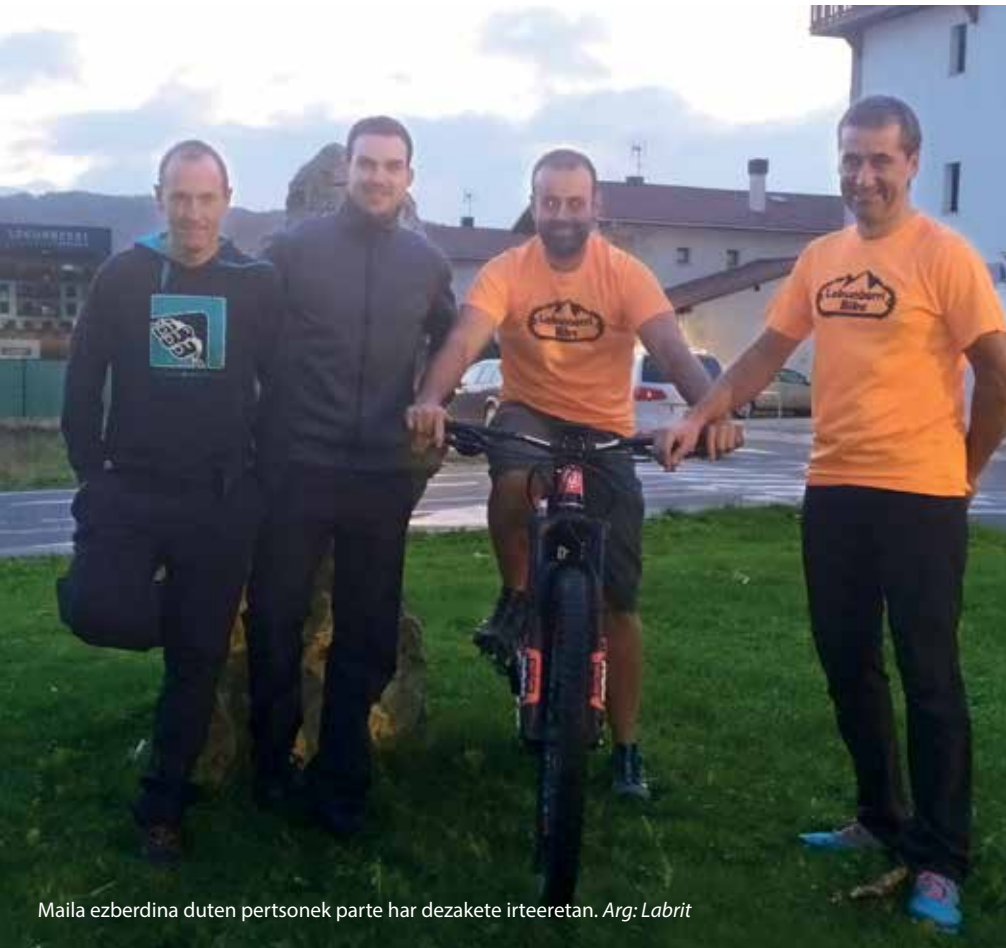
Maila ezberdina duten pertsonak parte har dezakete irteeretan.

I. Garcia: Nik pertsonalki, nire alaba jaio zenean taldea utzi egin nuen beste lehentasun batzuk nituelako eta nahiko deskonektaturik egon naiz azken bost urteotan. Baina joan den udaberrian, maiatzean, bizikleta bat erosi nuen eta hauek zirikatzen hasi nintzen berriro ere elkarrekin irteteko. Nik beti sentitu izan dut hemen BTTaren alde zerbait egin behar genuela. Bike park bat egiteko ideiarri bueltan ematen hasi ginen eta Udal berriarekin osaketarekin batera Udalean gure ideiak aurkezteko aprobeztatu genuen. Legegintzaldi berriarekin batera, Kirol Batzordearen lehen bileran izan ginen, eta