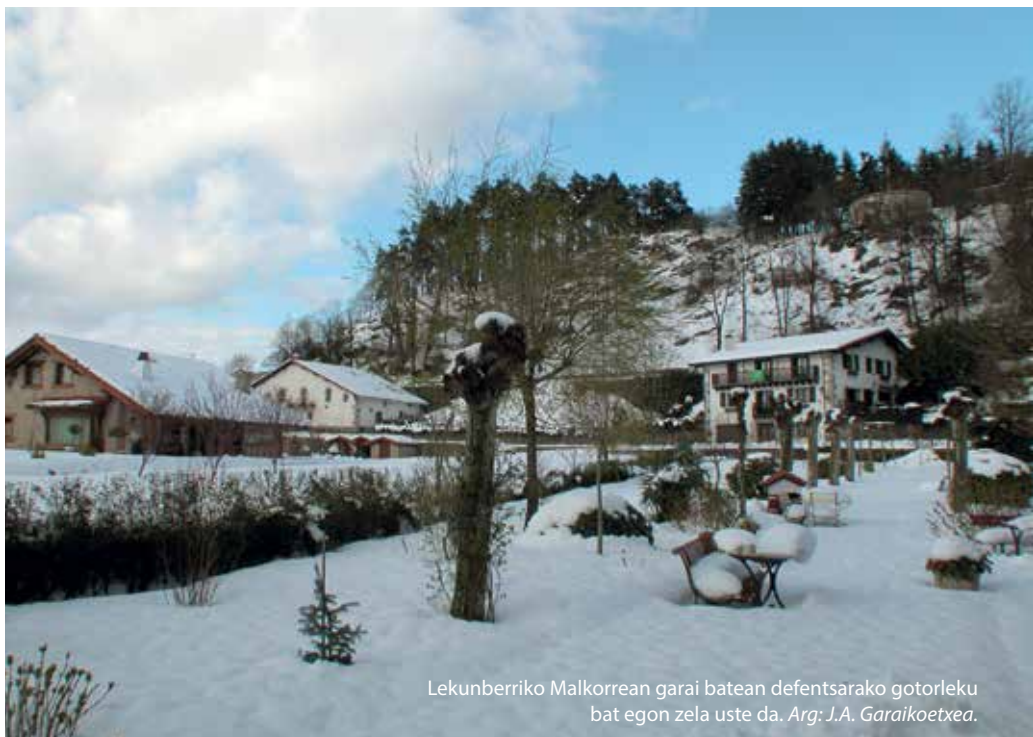
Lekunberriko Malkorreen garai batean defentsarako gotorleku bat egon zela uste da.

bertan egonen naiz nahi beste azalpen ematen. Beraz, jendea Santa Barbarara igotzera animatzen dut, lekua eta bere historia ezagutu dezatela. Denon artean Nafarroako Gobernuak proiektu honekin aurrera egiten utz diezagula lortu behar dugu. Gaztelu txikia da eta posible da. Inguruan zeuden Erdi Aroko elementu gehienak desagertu egin dira, Gorritiko gaztelua gelditzen zaigu eta ezin dugu bere horretan utzi.