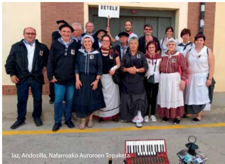
Iaz, Andosilla, Nafarroako Auroroen Topaketa.

Poztekoa da, baina uste dut urduri jarriko naizela jendearen aurrean. Baina eskertzekoa da. Gainera egun horretan abestera irtengo gara. Ea horrela jendea abestera animatzen den eta tarteka entseatzera hurbiltzen diren. Ez dira elizako abestiak izanen, baizik eta abesti herrikoiak. Polita izanen litzateke beste hainbat herritan egiten duten moduan tarteka kalera irtetea abestera.