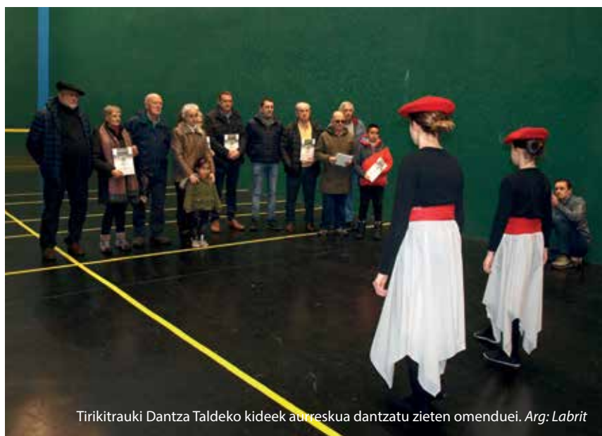
Tirikitrauki Dantza Taldeko kideek aurraskua dantzatu zieten omenduei.

1976an trinketearen ondoan zegoen frontoi handia estali eta moldatu bazen ere, trinketeak bere txikitasunean beti izan du mugimendu handia. Hasierako urteetako pilota partida eta apustuez gainera, bertan hainbat eta hainbat ekitaldi egin izan dira, herri kirola, ekitaldi politikoak, parrandak, herri-bazkariak, musika taldeen entsegu-leku ere izan da... Eta espero dezagun, txoko horri herriarrentzako bilgune izaten jarraitzea aurrerantzean ere.