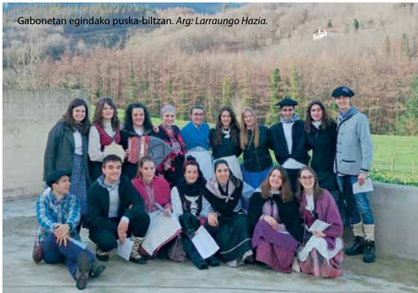
Gabonetan egindako puska-biltzan.