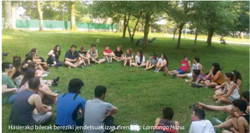
Hasierako bilerak bereziki jendetsuak izan ziren.

egungo gizartean asko ahazten zaigun gai bat dela ikusten dugu. Norberak bere buruan bakarrik pentsatzera eraman gaitu gizarteak, arrakasta pertsonalean bakarrik pentsatzera eta, askotan, ahaztu egiten zaigu gure oinarri-oinarrian dugun gauza bat, besteen beharra daukagula eta behar hori harremanekin asetzen dugu. Hori gizakion ongizaterako funtsezkoa da. Horregatik, harremanen gaia landu nahiko genuke. Oso gai zabala denez, bost lan ildo zehaztu ditugu.