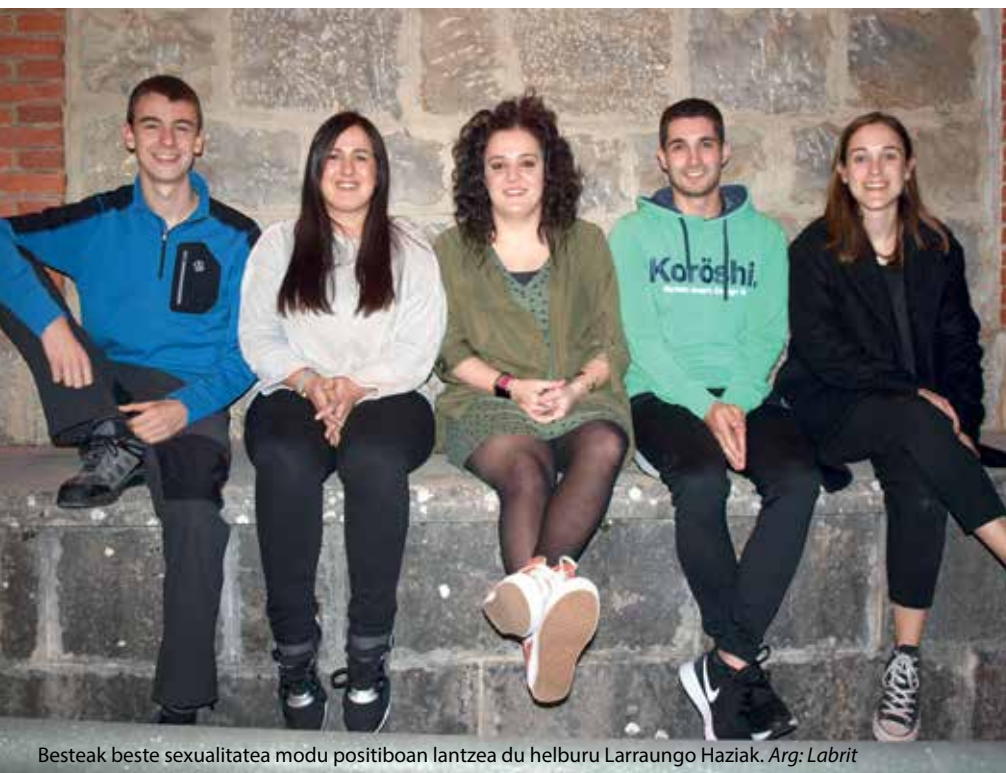
Besteak beste sexualitatea modu positiboan lantzea du helburu Larraungo Haziak.

Xanti: Nik uste kuadrilen artean dagoen konexioa edo tarteka batzea lortzen duten gauzak afizioak eta kirolak direla. Kirolaren edo musikaren inguruan kuadrila batekoak eta bestekoak elkartzen gara. Horiek horretarako aukera ematen digute.