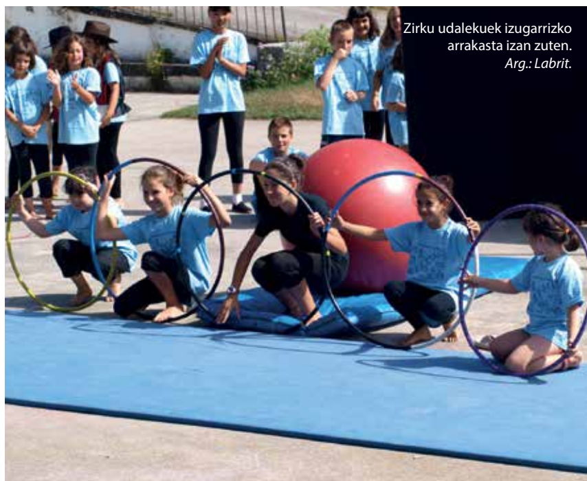
Zirku udalekuek izugarritzko arrakasta izan zuten.

K: Azken batean proiektu honetako beste zutabe bat da, gu laurok bezain garrantzitsua izan da.