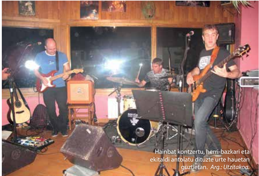
Hainbat kontzertu, herri-bazkari eta ekitaldi antolatu dituzte urte hauetan guztietan.

P: Nik umeekin txangoak egiten nituen eta kobazuloaren parera iristen ginenean, korrika etortzen nintzen sukaldean sartzeko.