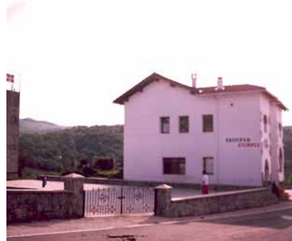
Oraindik alboko portxea eraikitzeke zuela.

“Erretiroa hartu aurreko azkeneko txanpan harrapatu gaitu”