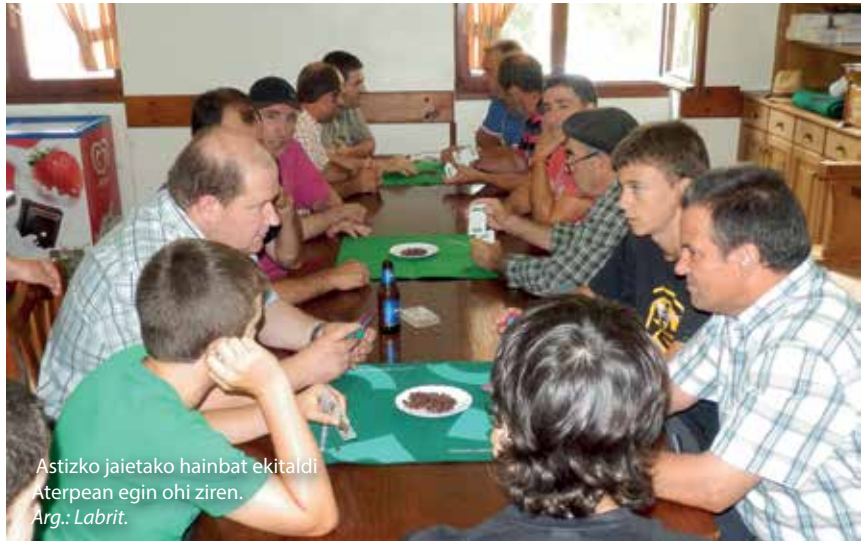
Astizko jaietako hainbat ekitaldi Aterpean egin ohi ziren.

N: Ez dago ixteko modu hoberik. Onen-onenean utzi dugu. Bai gure aldetik dena eman dugulako eta baita jendea gurekin gustura zegoelako ere.