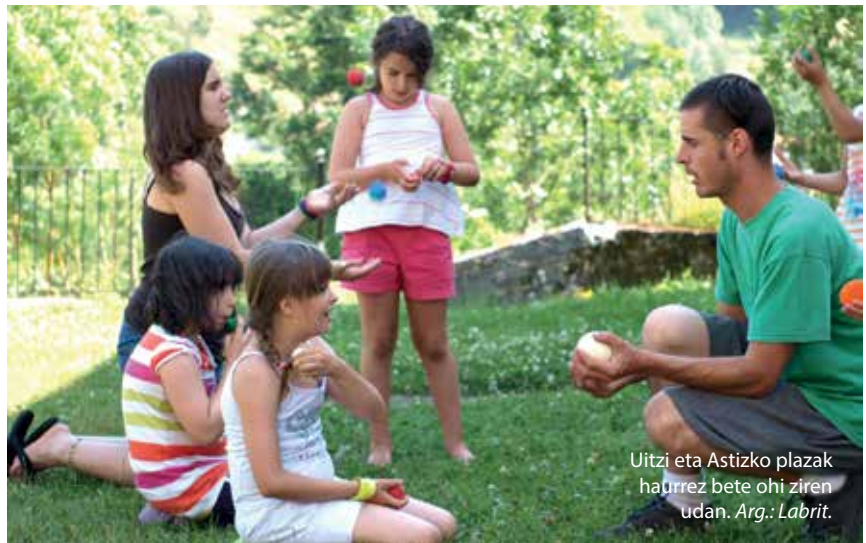
Uitzin eta Astizko plazak haurrez bete ohi ziren udan.

ra joan, bertan bazkaldu eta ondoren oinez Uitzira etortzen ziren.