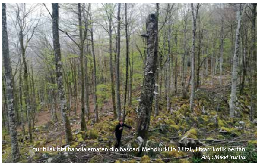
Egur hilak bizi handia ematen dio basoari. Mendiurkillo (Uitz), Etxarriko bertan. Arg.: Mikel Irurtia.

tertzeko lana eman zigun 2016an, baina ez genuen okil gibelnarrik aurkitu. Bertan bizi zedin egokiak ziruditen zuhaitzi batzuk identifikatu genituen, baina batez ere egur hilak eza aurkitu genuen nonahi. Bestalde, oraindik ez dugu behar bezala eza gutzen okilak zer ibilbide erabiltzen duen baso batetik bestera mugitzeko, ezta baso horietatik Aralarrekora mugitzeko erabiliko lituzkeen ibilbideak ere, han inoiz bizileku egokirik topatuko balu.