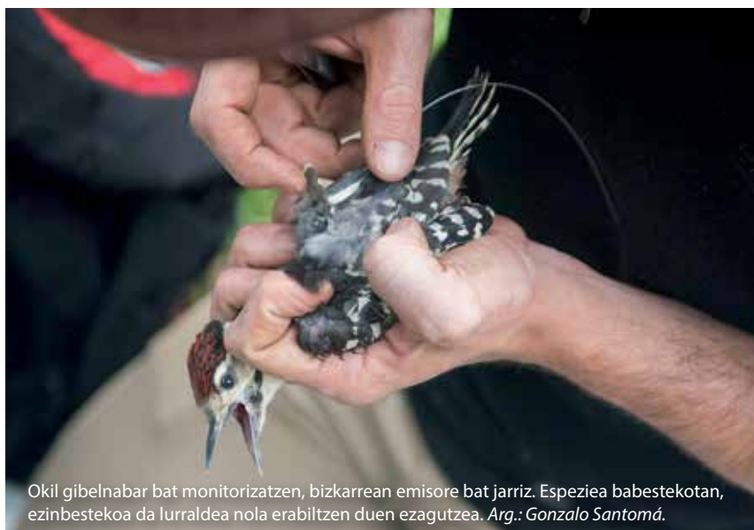
Okil gibelnabar bat monitorizatzen, bizkarrean emisore bat jarritz. Espeziea babestekotan, ezinbestekoa da lurraldea nola erabiltzen duen ezagutzea.

Bera bizi den oihanaren gestioari dagokionez, hegaztiaren kontserbazioa eta egurraren ustiapena bateragarri egitea da kontua. Horretarako, bi