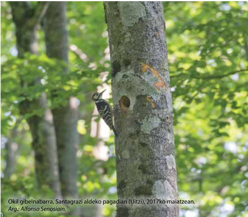
Okil gibelnabarra, Santagraz aldeko pagadian (Uitzi), 2017ko maiatzean.

Okil gibelnabarra, ongi kontserbaturiko oihanetako espezialista da. Horrek esan nahi du baso handiak behar dituela eta arboladi horietan baldintza natural batzuk gertatu behar direla, hala nola zuhaitzen gaixotzea, zahartzea, zulatzea, usteltzea, hiltzea, erortzea (batzuetan erortza handiak, 2017ko abenduan