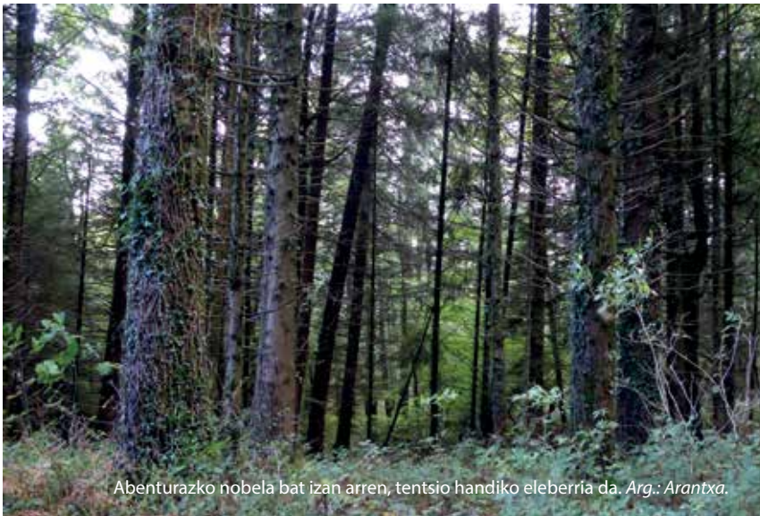
Abenturazko nobela bat izan arren, tentsio handiko eleberria da.

Oraingoz Amazonen dago eskuragarri formatu digitalean nahiz fisikoan. Egoerak uzten digunean tertulia interesgarriren bat antolatzea gustatuko litzaidake, bertan liburuak aurkezteko eta liburuak herritarrei modu zuzenagoan eskaini ahal izateko.