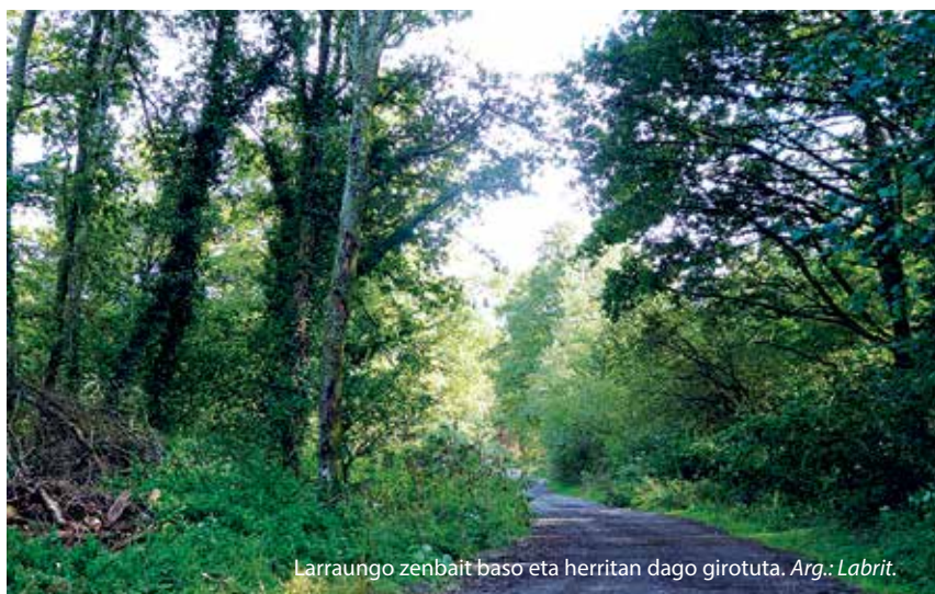
Larraungo zenbait baso eta herritan dago girotuta.

Lekunberri eta Baraibar aipatzen dira, zenbait ezaugarri faltsutuak izan diren arren, noski. Baita Baraibarko usategiak ere, bertan bizi dituzten momentu esanguratsuenak. Ikuspuntu literariotik eta fikzioa idazteko dena eskaintzen zidan. Larraun (Lekunberriekin batera) esan dezakegu hamazazpi herrik osatzen duten mikrokosmos bat dela. Eleberria idazten nuen bitartean Larraungo mapa nuen paretan zintzilikatuta. "El señor de los anillos" idaztea bezala izan da, baina mundu bat sortzeko beharrik gabe. Gusatzen zitzaidan bertako basoek duten sakontasuna, euria... Istorioa perfektuki osatzeko elementu guztiak eskaintzen zizkidan. Eta bestalde, maila pertsonalean, uste dut ez dela erraza jaiotzez bertakoa ez zaren lekuan integratzea, are gutxiago halako identitate handiko leku batean. Baina eleberria hemen kokatzeak pertsonalki "hemengoago" sentitzen lagundu didala uste dut.