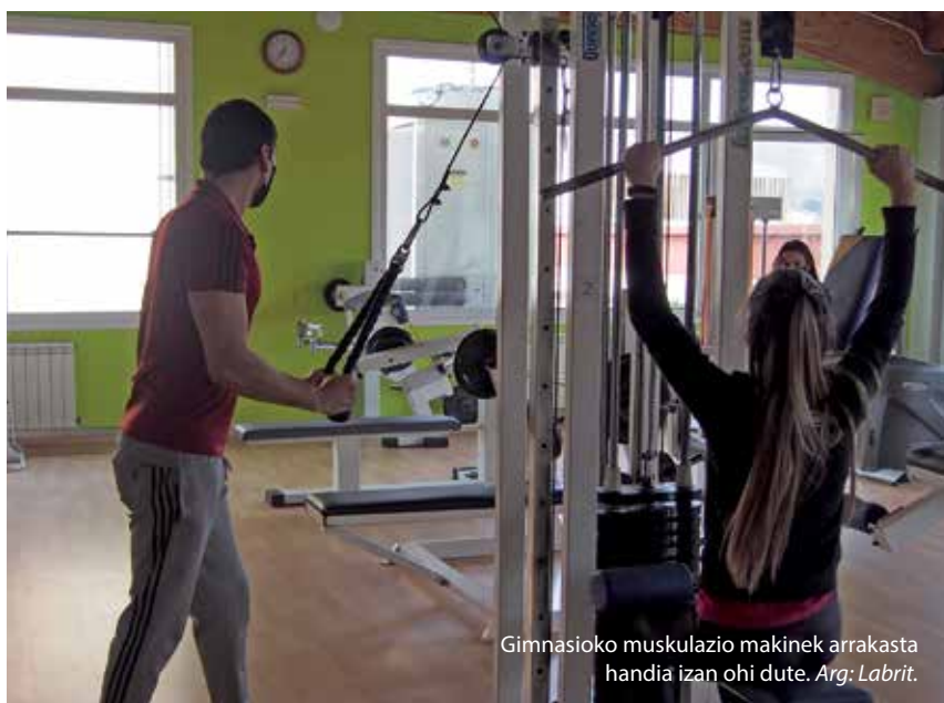
Gimnasioko muskulazio makinek arrakasta handia izan ohi dute.