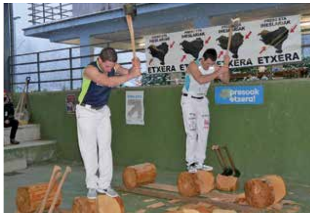
Betelu-Araizko SARE Herriarraren partaideak.

bidea" Sare abian jarri duen dinamika da; euskal preso eta iheslariaren egoerari irtenbidea emateko urratsak eman eta kilometroak egitea da asmoa. 3.127.326 km hain zuzen ere!, Euskal Herriak adina biztanle. Ekimenaren oinarrian elkarbizitzaren eta bakearen aldeko ibiltariaren sare erraldoia osatzeko erronka dago. Kilometroak zenbatzeko telefono mugikorrenzako aplikazioa sortu dute, oinez, bizikletan, korrikan,.. App-a deskargatu eta ekin bideari. Hileko azken ostiralekin jarraitzen dugu, negurako ordua aldatua, Beteluko aparkalekuan zazpi eta erdietan elkartzen ari gara. Azken preso eta iheslariak kalean izan arte, salaketa kalean presente egon dadin saiatuko gara, kontzentrazioak eginez bada ere. Animo guztiei eta gehien bat, kartzeletan gatibu dauden presoiei eta etxera ezin itzuliz dauden iheslariari. Bakerako bidea luzea da baina lortuko dugu, bake justu eta iraunkor bat.