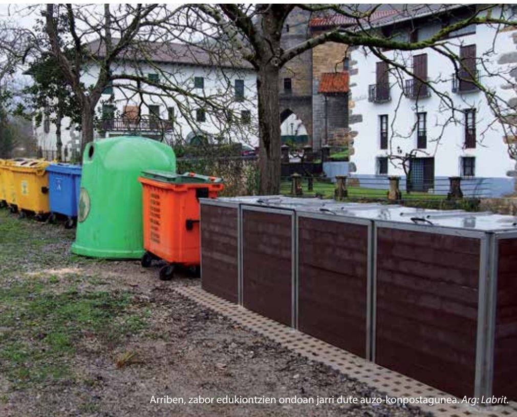
Arriben, zabor edukiontzien ondoan jarri dute auzo-konpostagunea.

Herritar batzuek urte asko daromatate jada konposta egiten eta beste batzuk pixkanaka ohitzen ari dira.