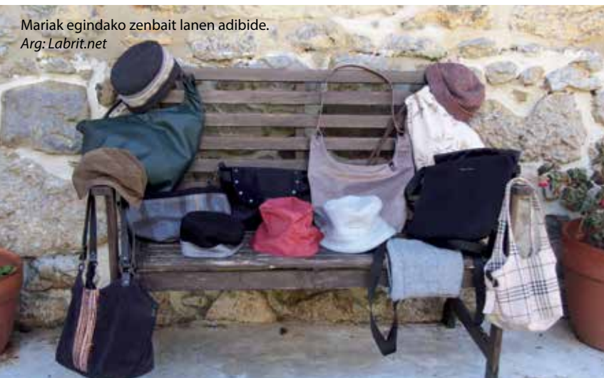
Mariak egindako zenbait lanen adibide.

Bai, iaz egin nuen nire alabak animatuta, baina nire kasuan ahoz ahoko du arrakasta, bai Donostian edo Tolosaldean eta baita hemen ere.