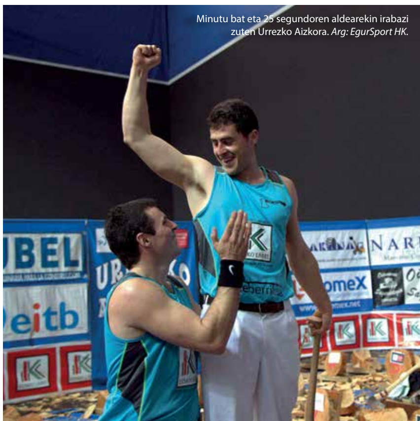
Minutu bat eta 25 segundoren aldearekin irabazi zuten Urrezko Aizkora.

Txomin: Gu ez gara tartean egon, eta ez dakigu ongi zer gertatu den, baina kontua da federazioak ez zituela aizkolariek kontuan hartzen. Aizkolariek kirola bera hobetu nahi zuten, pentsatzen baitzuten gauza batzuk zaharkituta geratu direla, eta