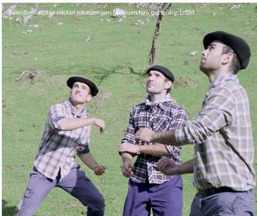
Balerdiren azpian pilotan jokatzen jarri genituen hiru gazte.

Prozesu bidegabe hura ulertzea zaila bezain sinplea da. Historian atzera egiten badugu eta Erdi Aroan kokatzen bagara. Baskoien lurralde honetan, jendea herri sakabanatuetan bizi zen eta naturarekin harreman