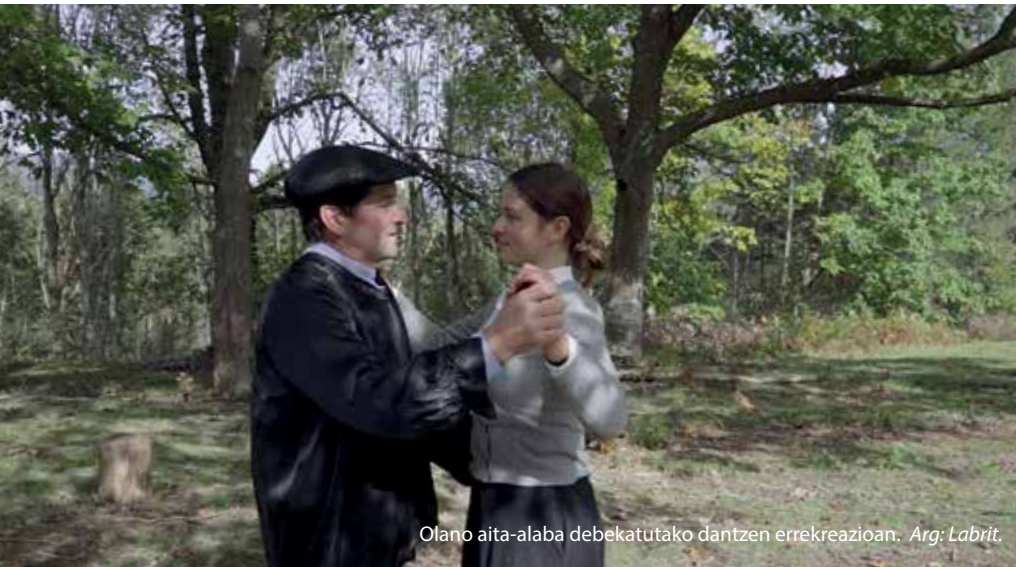
Olano aita-alaba debekatutako dantzen errekreazioan.

Sorgin salaketa hauek, herritarrengan beldurra zabaltzeko erabili zituzten Anduezako jauntxoek.