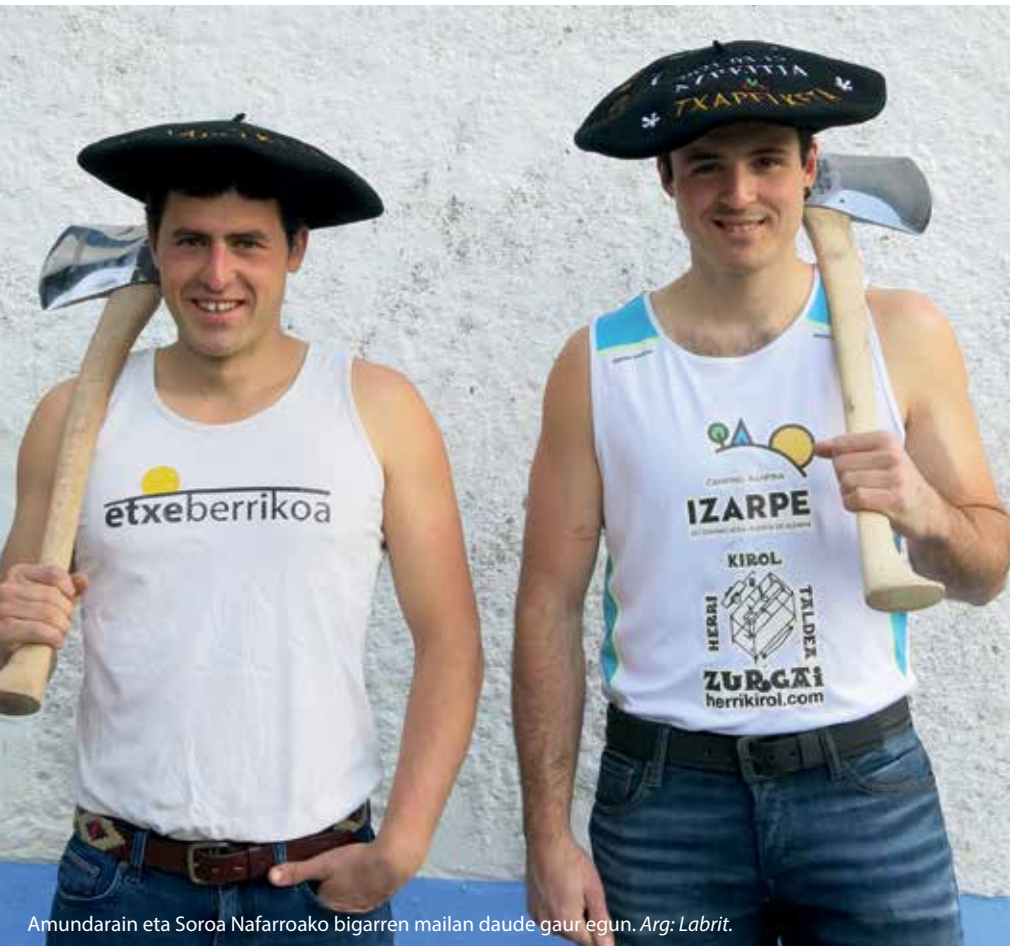
Amundarain eta Soroa Nafarroako bigarren mailan daude gaur egun.

Ibai: Txomin lesionatuta zegoenez, nik beste batekin hartu nuen parte aurreko kanporaketan.