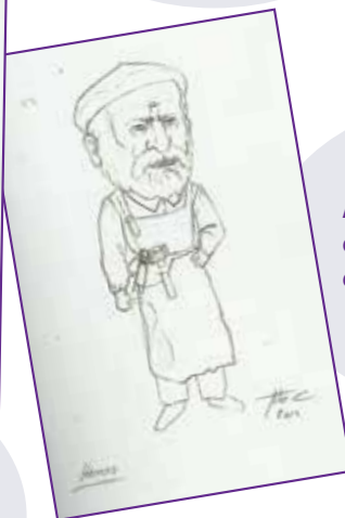
AROTZA: Artisan lanei eskeinia, bereziki inguruan egindako zintzarriei.