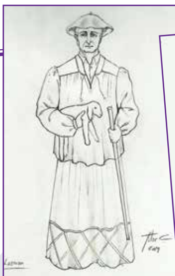
LARRAUN: Inguruan artzaintzak eta animaliek duten garrantzia irudikatzen du.