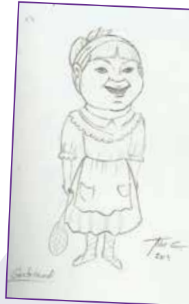
GAZTAUNDI: Inguruan aski ezaguna den ezizena.