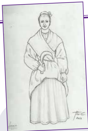
LARRAIN: Nafarroako emakumeen lana irudikatzen du.