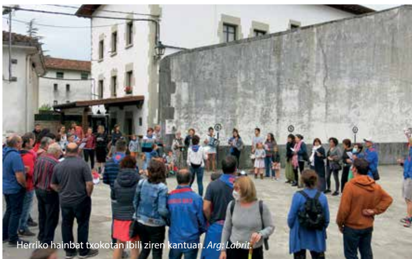
Herriko hainbat txokotan ibili ziren kantuan.