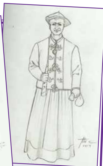
NAPAR: Nafarroako ohiturak sinbolizatzeko egina. Dirudun zaku bat dauka, apustuei erreferentzia egiteko. Beste eskuan, txupipiña.