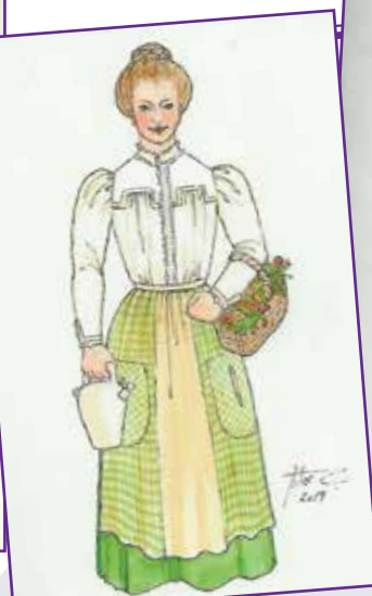
MALLOA: Aralar, Malloak eta emakumeek naturarekin duten harremana sinbolizatzen ditu.