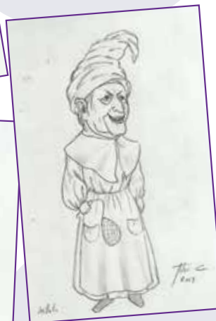
KATTALIN: Sorginak irudikatzeko kilikua.