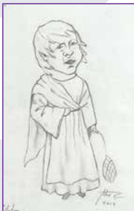
ELUTSA: Hotza eta haizea sinbolizatzen ditu.