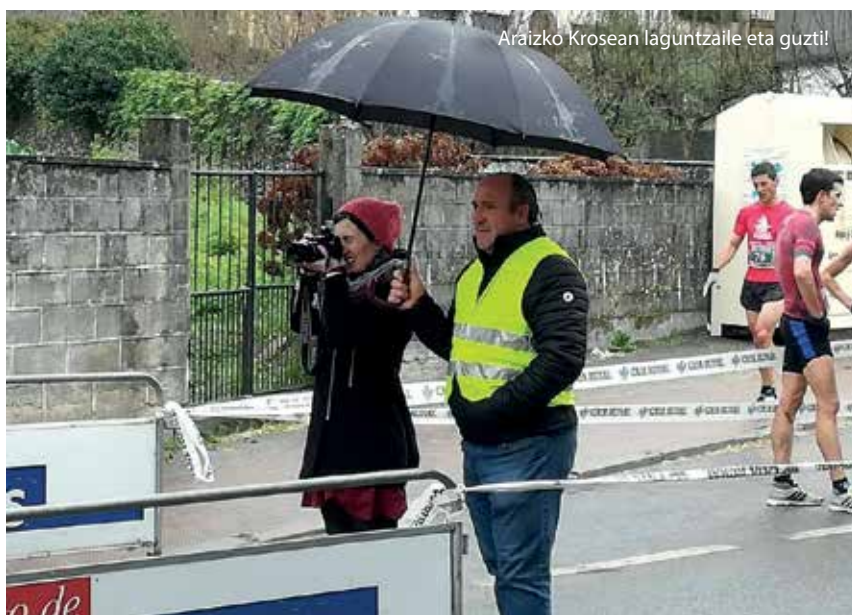
Araizko Krosean laguntzaile eta guzti!

Zorionez, ez askorik. Adibidez, oso gogorra egin zitzaidan Larraun-Le- kunberrin Ibarberriko erreferentzia zentroaren gaiarekin egon zen ga- tazka hura, 2014an. Lekunberriko eta Larraungo udalak tartean zeuden, eta, nire ustez, nahiko isilik egon zi- ren. Herrian eztabaida bat sortzen ari zen, bitan banatzen: batzuk Biurda- na erreferentzia zentro gisa man- tentzearen alde zeuden eta beste batzuk Amazabal institutuaren alde. Gurasoak eta bizilagunak borrokan, eta udalak, herritarren ordezkari direnak, isilik. Niri bi aldeetako jen- dea etortzen zitzaidan, eta nik udal ordezkarien erantzuna behar nuen. Lotsagarria izan zen urte hartan udal