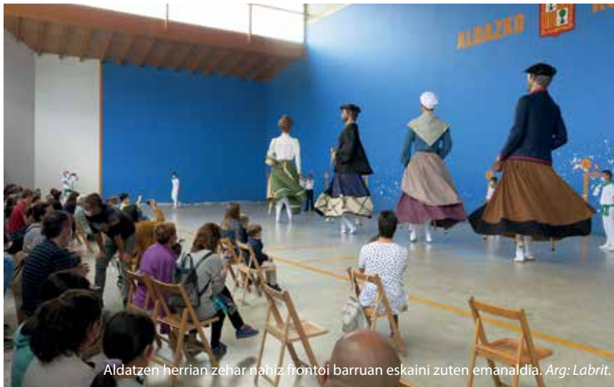
Aldatzen herrian zehar nahiz frontoi barruan eskaini zuten emanaldia.

Zer egin nahi zuten argitzean, erraldoiak eta figurak egiteaz ardu-