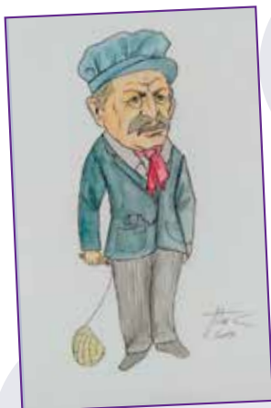
MAKINISTA: Plazaolan izandako makinistaren omenez egina.