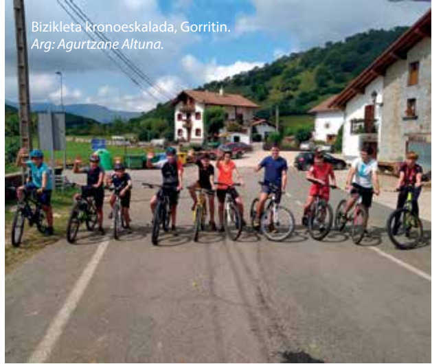
Bizikleta kronoeskalada, Gorritin.