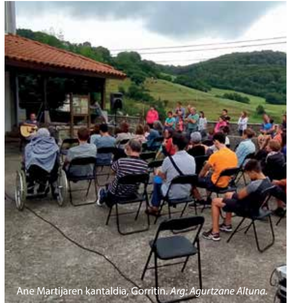
Ane Martijaren kantaldia, Gorritin.