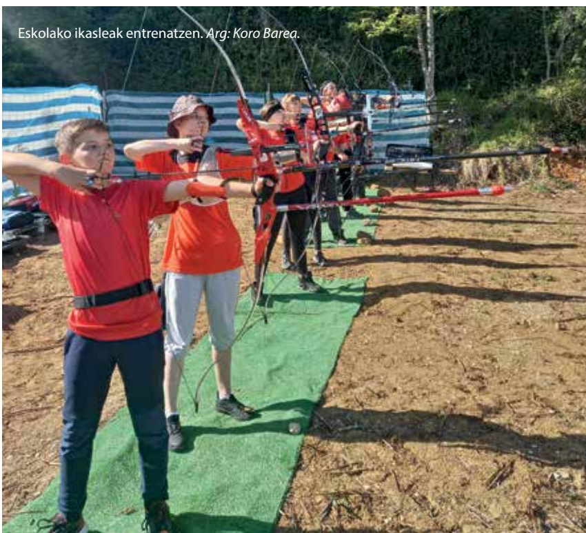
Eskolako ikasleak entrenatzen.

Lekunberriko Udalarekin hainbat hartu-eman izan ondoren, eta hainbat arrazoiengatik kluba osatzeko haren kudeaketa ezinezkoa zenez, gurasoak