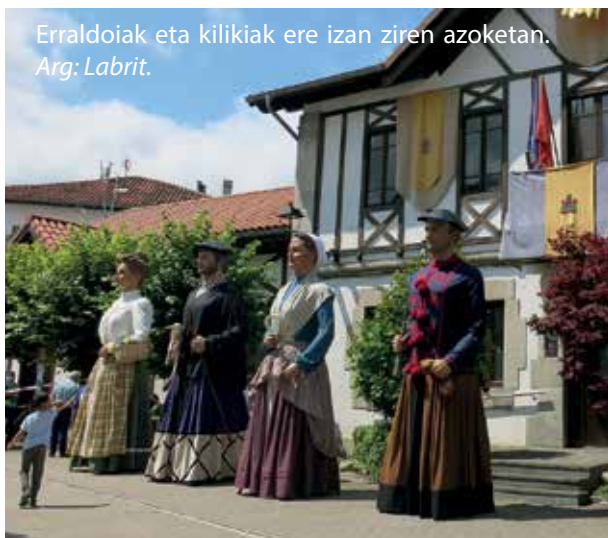
Erraldoiak eta kilikiak ere izan ziren azoketan.