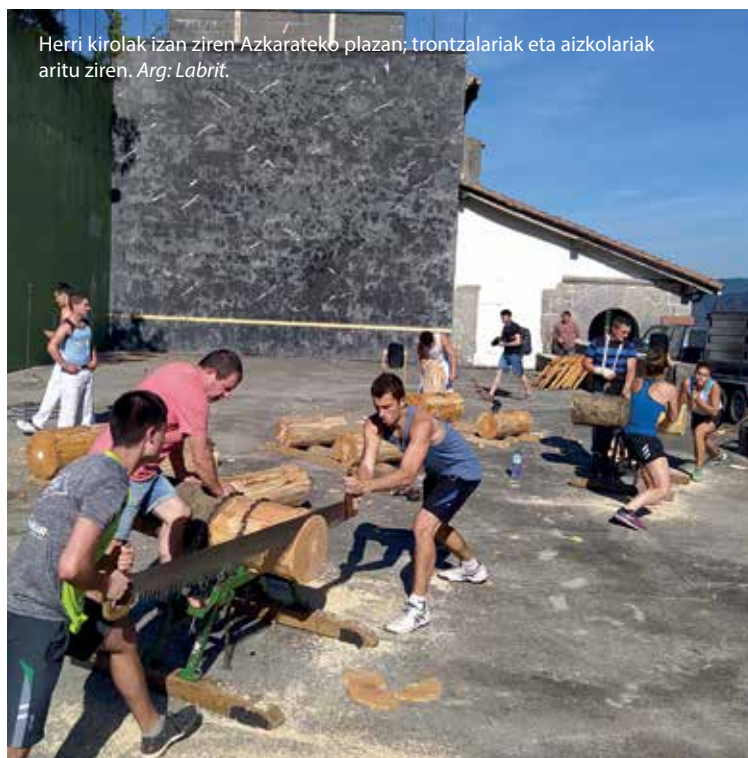
Herri kirolak izan ziren Azkarateko plazan; trontzalariak eta aizkolariak aritu ziren.