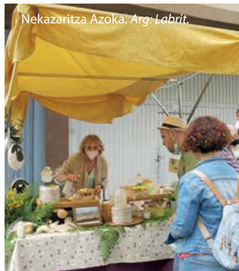
Nekazaritza Azoka.