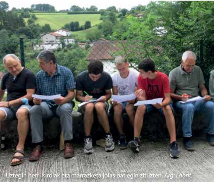
Uztegin herri kirolak eta marrazketa jolas bat egin zituzten.