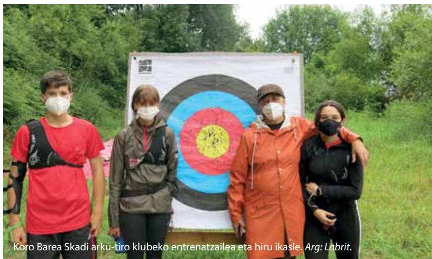
Koro Barea Skadi arku-tiro klubeko entrenatzailea eta hiru ikasle.

Skadi arku-tiro kluba iazko irailean jarri zuten martxan, Lekunberrin, eta kirol hori ikastera eta horretaz gozatzerantz animatu ziren gaztetxoek emaitza oso onak lortu dituzte Nafarroako eta Espainiako arku-tiro txapelketetan. Eskola hilabete honetan hasiko da berriro ere entrenamenduekin, eta izen ematea irekita dago: 10 eta 14 urte arteko gazteei zuzenduta dago, eta izen emateko 615 757 400 zenbakira deitu edota skadi.navarra1@gmail.com helbidera idatzi behar da.