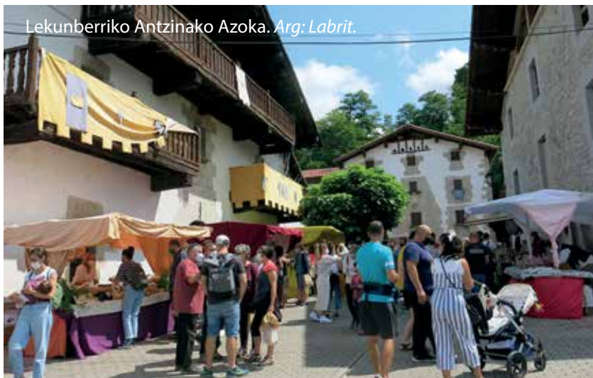
Lekunberriko Antzinako Azoka.

Azokak ezinbestez egin beharreko bisita bihurtu dira azken hilabeteotan Lekunberrin, eta udan ere segida izan dute. Urtero egiten duten Antzinako Azokan giro paregabea izan zen, eta artisautza, tradizioa eta gastronomia izan ziren horren lekuko. Abuztuaren hondarrean, berriz, Nekazaritza Azoka prestatu zuten, Iturritak kalean.