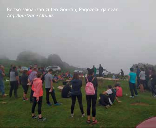
Bertso saioa izan zuten Gorritin, Pagozelai gainean.