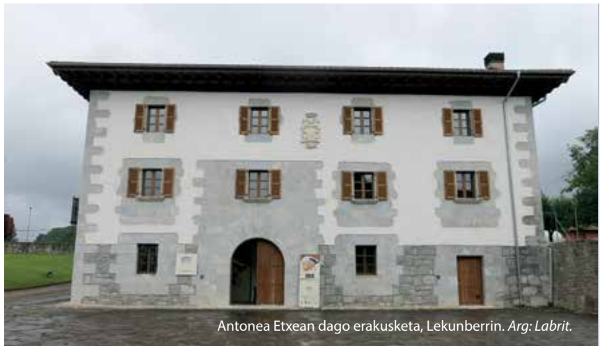
Antonea Etxean dago erakusketa, Lekunberrin.

naturaren begietatik ikusita garrantzitsua bada ere, lehen ere, orain dela 100 urte, ikerlari askorentzat helmuga bat zela".