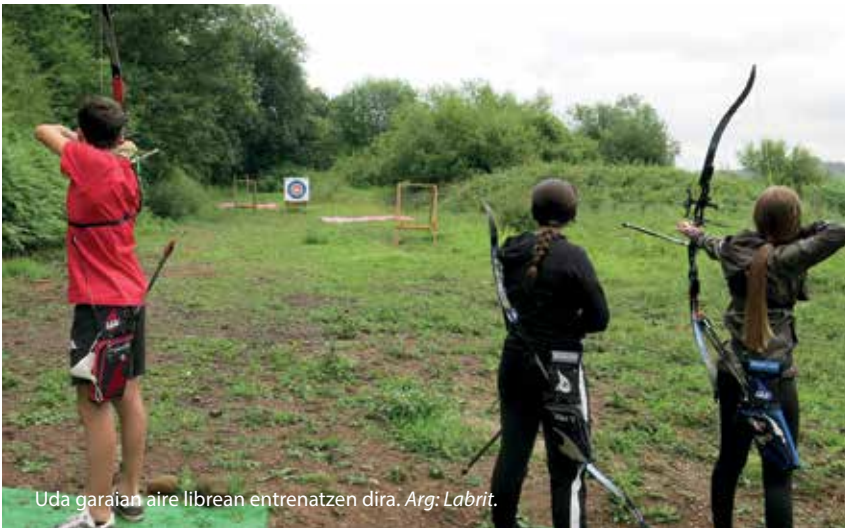
Uda garaian aire librean entrenatzen dira.

elkartu ginen, eta erabaki genuen geure kabuz sortzea kluba, eta horrela sortu genuen Skadi eskola. Gaur egun kolaborazio hitzarmen bat dugu Lekunberriko Udalarekin, eta Larraungo Udalaren babesa dugu.