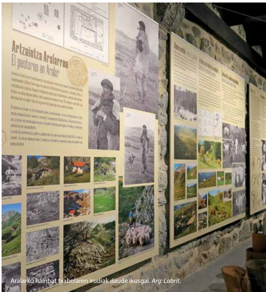
Aralarko hainbat txabolaren irudiak daude ikusgai.