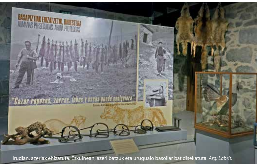
Irudian, azeriak ehizatuta. Eskuinean, azeri batzuk eta uruguai basoilar bat diseatuta.

gaur egun daukagun fauna eta flora ez dela beti horrela izan; ehizari buruz hitz egiten dugu lehenengo hemen". Benetan txundigarria da txoko honetan ikus daitekeen lehenengo argazkia: gizon bat ageri da, atzean azeri pila bat ehizatuta dituela. 1970eko hamarkadako argazki bat da. Basapiztiak ehizatzen, babestera izena jarri diote atal honi; hain zuzen, lehen ehizatu ohi ziren animaliak batzuk gaur egun babestu egiten direlako, hala nola azkonarrak. Bestalde, gaur egun ez dauden espezie batzuk aipatzen dituzte, eta Aranzadin ziztuzten diseatutako espezie batzuk erabili dituzte; uruguai basoilar bat,