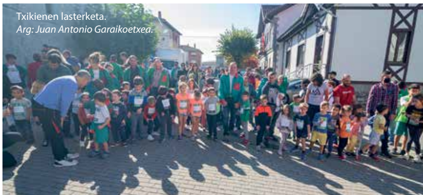
Txikienen lasterketa.