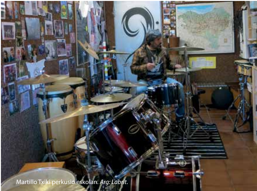
Martillo Txiki perkusio eskolan.