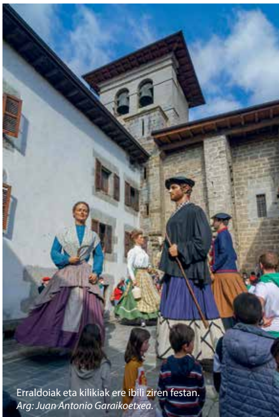
Erraldoiak eta kilikiak ere ibili ziren festan.