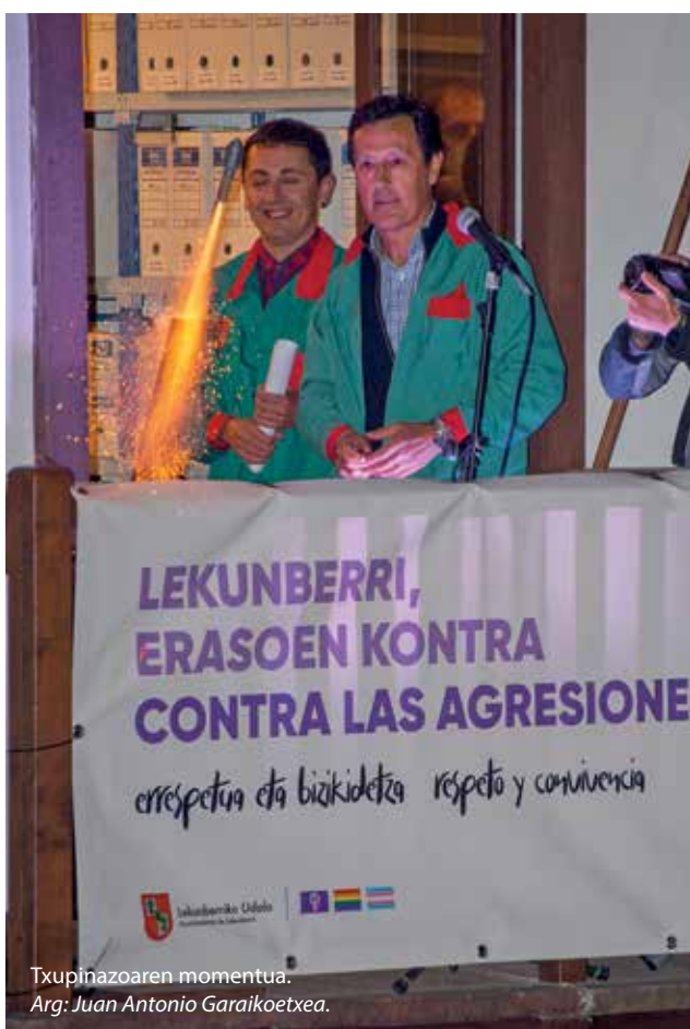
Txupinazoaren momentua.