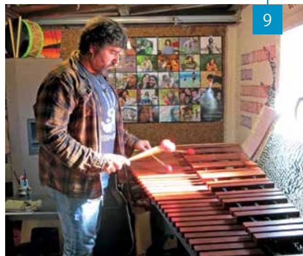
Marimba instrumentua jotzen.

Ez, musika eskola baino ez, baina beste modu batean lantzen dute.