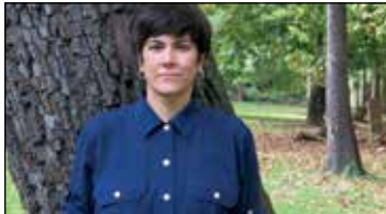
Arantza Santestebanen film laburra.