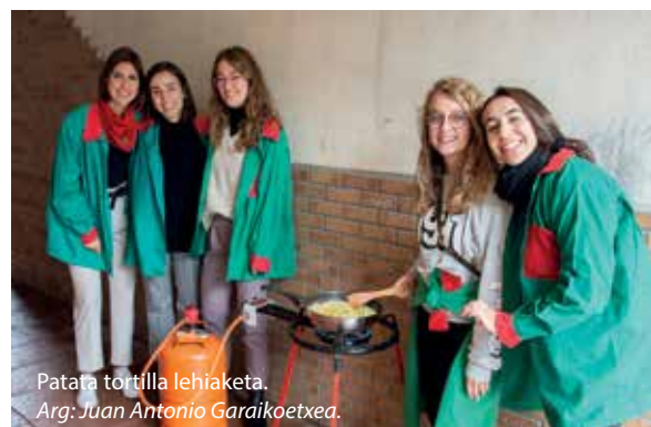
Patafata tortilla lehiaketa.