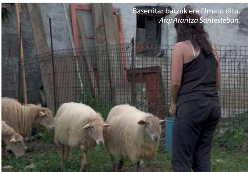
Baserritar batzuk ere filmatu ditu.