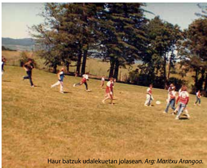
Haur batzuk udalekuetan jolasean.

handia dute horregatik, eta are gehiago amaitu den moduagatik: "Niri pena handia ematen dit horrela bukatu izanak. Gazteak jada etorriko ez balira edo funtzionatuko ez balu, ulertuko nuke bukatu behar izatea, baina ikusita ongi funtzionatzen zuela, pena da", adierazi du Juanjok atsekabetuta. "Hiltzen utzi dute", gehitu du Anak. "Halere, balorazioa orokorrean oso positiboa da", esan du Juanak.