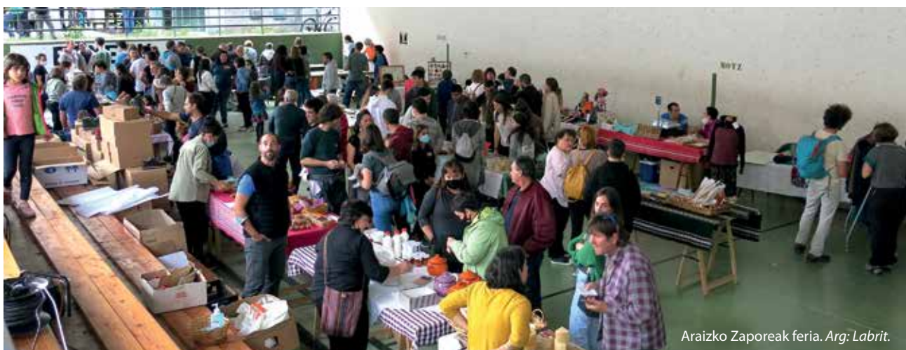
Araizko Zaporeak feria.