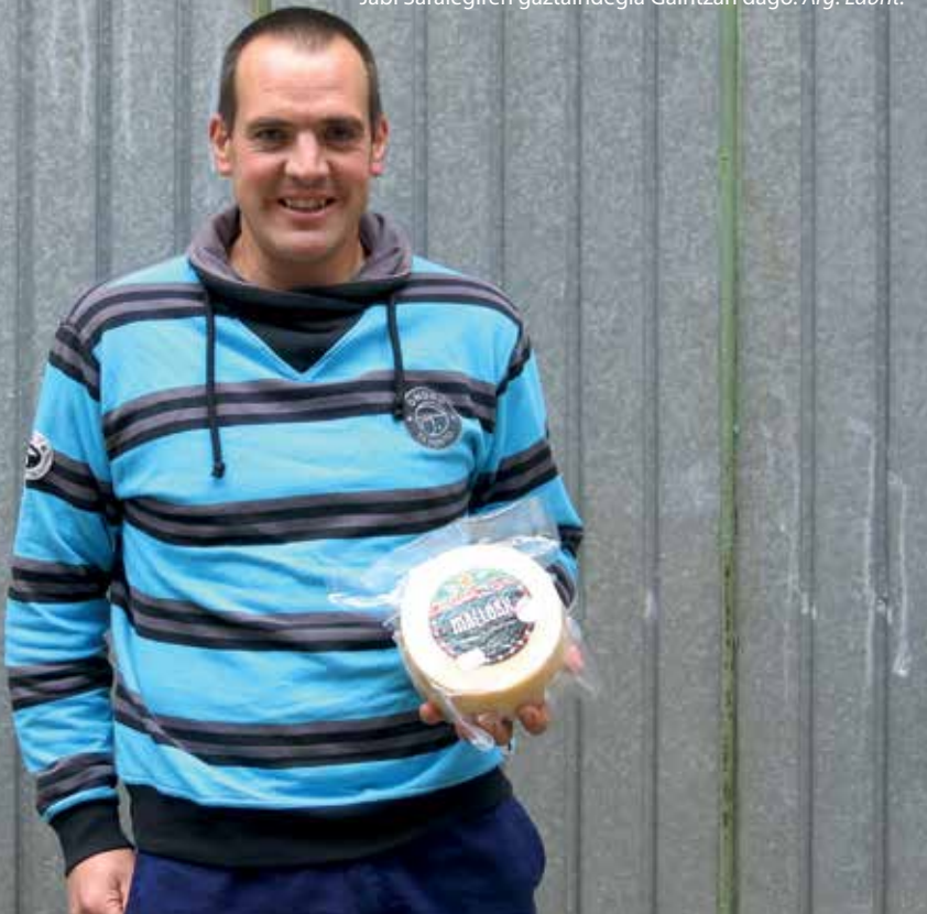
Jabi Saralegiren gaztandegia Gaintzan dago.

Ongi. Ardiekin erraza izan zen, ohituta nengoelako, eta betiko martxarekin segitzea baino ez zen. Gaztaren kasuan, mundu berri bat zen niretzat. Gainera, mundu zabala