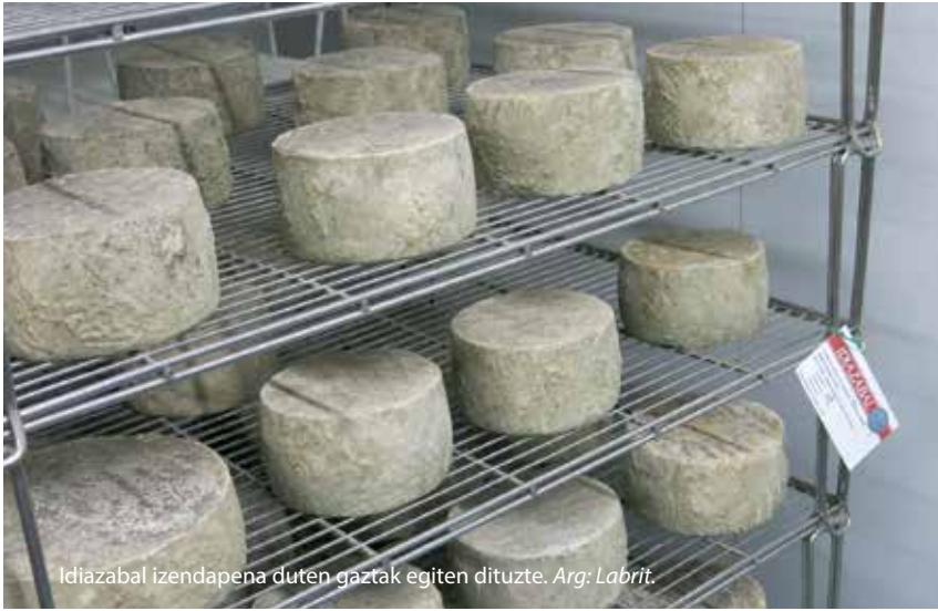
Idiazabal izendapena duten gaztak egiten dituzte.

ikusten dela, artzain gazte asko, eta asko emakumeak dira, gainera. Nik uste dut asko direla artzaintzan aritzen diren gizonen bikotekideak; gizonak artzaintzaz arduratzen dira, eta emakume asko, berriz, horrelako bileretara joateaz eta gazta egiteaz; gaztagintzaren martxa emakumeen eramaten dute. Azken finean, dena ezin du pertsona bakarrak egin. Lan handia da, eta gazta egiteak ere lan handia eskatzen du. Leku askotan, baserrian ere horrela funtzionatu izan du orain arte, eta orain ere horrela gertatzen dela ematen du. Etxeko batek kanpoko batek baino errazago egiten du lan hori, eta konfiantza eskatzen duen lan bat ere bada. Lan honek horixe dauka: lotua da, baina zure askatasuna daukazu, eta zuk nahi duzunean egiten duzu ahal duzuna. Egun hobek eta txarragoak daude, denean bezala.