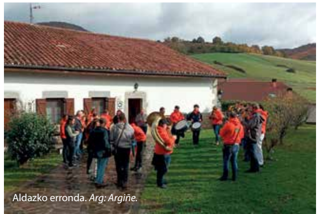
Aldazko erronda.

Azaroaren 11n da San Martin eguna, eta gure inguruko bi herritan ospatzen dituzte jaiak egun horren bueltan: Gaintzan eta Aldatzen. Gainera, Atallun Araizko Zaporeak feria egin zuten, urtero bezala, eta Mendialdeko azoka ibiltariaren azken parada izan zen, Lekunberrin.