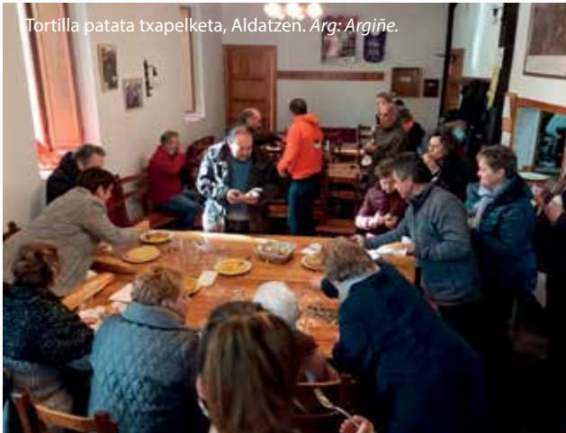
Tortilla patata txapelketa, Aldatzen.