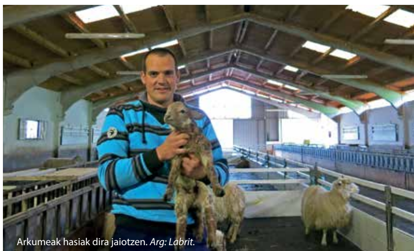
Arkumeak hasiak dira jaiotzen. Arg: Labrit.

Aurretik deituta etortzen dira lehen ere bezero ziren asko. Lehen agian gehiago saltzen zuten horrela, beti egoten zirelako etxean, baina ni askotan ez naiz hemen egoten. Aurretik deituz gero, ordua jarri eta gelditu egiten gara; jende dexente etortzen da horrela. Ulertzen dute