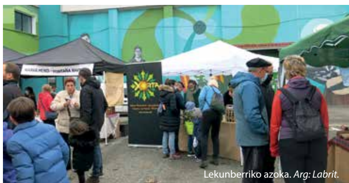
Lekunberriko azoka.