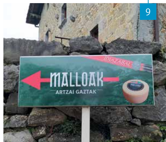
Herri sarreran ikus daitekeen kartela.

Hemen inguruan badira artzaintzan zertxobait aritzen diren gazte batzuk. Niri harritu nauena da Artzai Gazta eta horrelako bileretan edo bilera orokorretan jende gazte asko