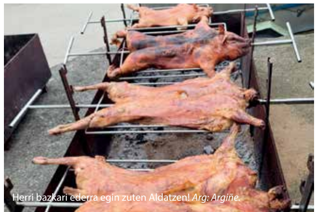
Herri bazkari ederra egin zuten Aldatzen!