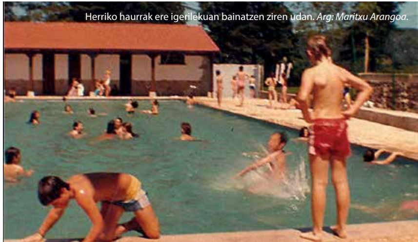
Herriko haurrak ere igerilekuan bainatzen ziren udan.

rilekuan bainatzera, herriko festetan bazkariak antolatzen zituzten Arotz Eneako frontoian, pilota partidak... herritar guztien topagune zen. Maritxu, gainera, oso ongi moldatzen zen udalekuak kudeatzen zituztenekin.