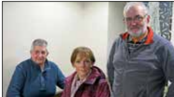
Ateak itxi ditu Arotz Eneak.