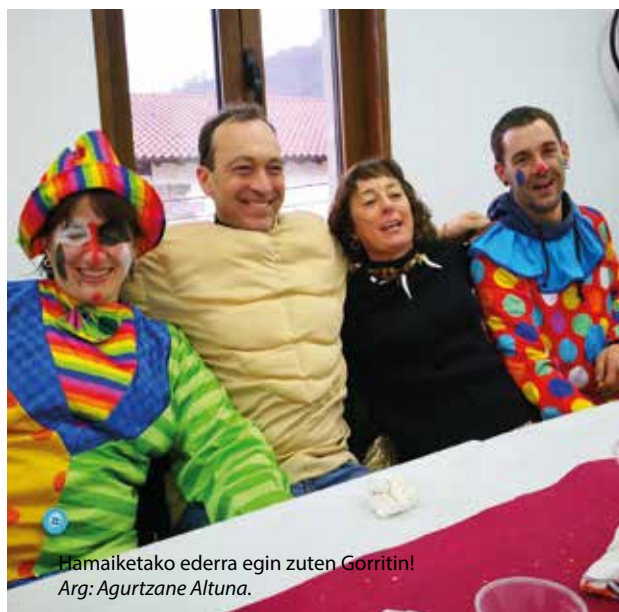
Hamaitetako ederra egin zuten Gorritin!