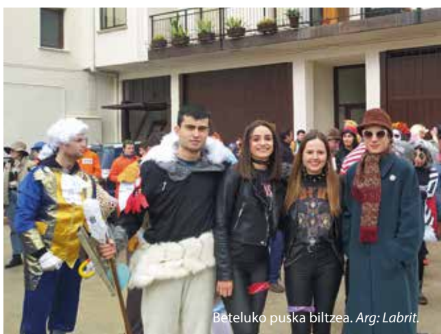
Beteluko puska biltzea.