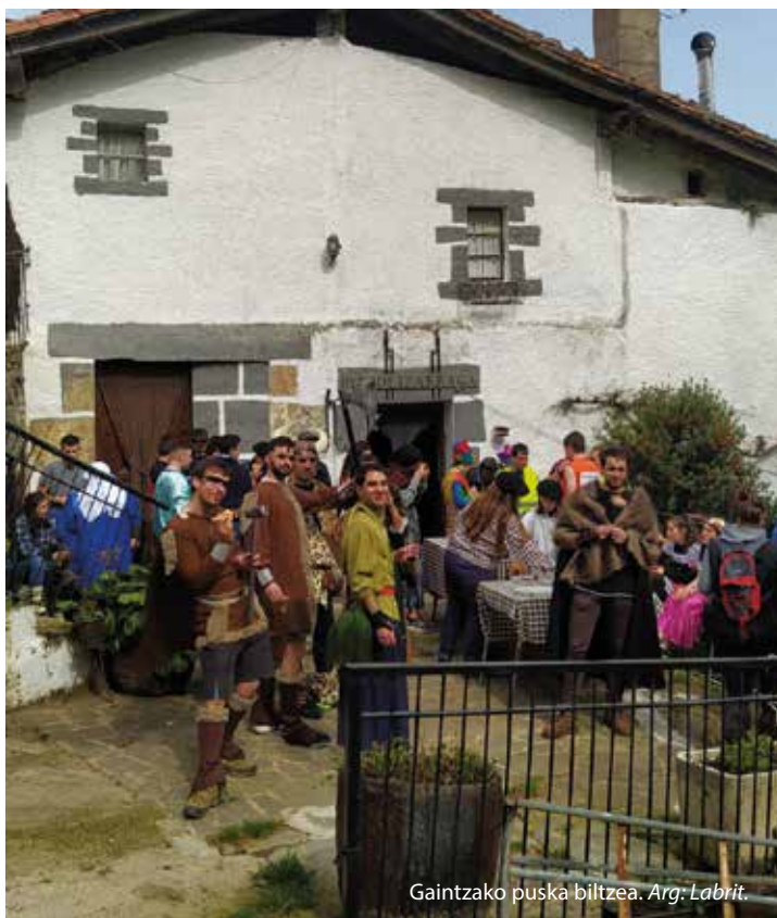
Gaintzako puska biltzea.