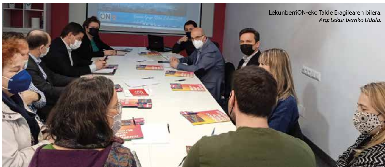
LekunberriON-eko Talde Eragilearen bilera.

alde egiten jarraitzeko. Gure gazteen eta langileen prestakuntzaren aldeko apustua egiteko garaia da, hurbileko eta kalitatezko enpleguaren bermatzaile gisa, eskaria eta eskaintza, eta haienganako laguntza uztartuz. Eta aukera berriak sortzea, enpresa eta enplegatuentzat, gazteentzat eta hain gazteak ez direnentzat, Lekunberriko inbertsio eta garapen profesional eta pertsonal berrietarako. Eta baita autonomo eta ekintzaileentzat ere, eta zergatik ez, geure burua ere prestatu bertan geratzeko iritsi den telelanerako espazioak egokituz.