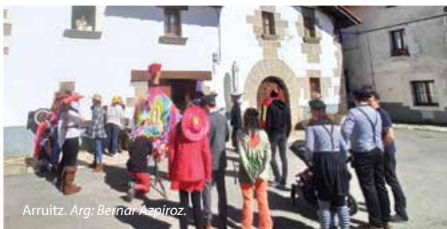
Arruiz. Arg: Bernar Azpiroz.