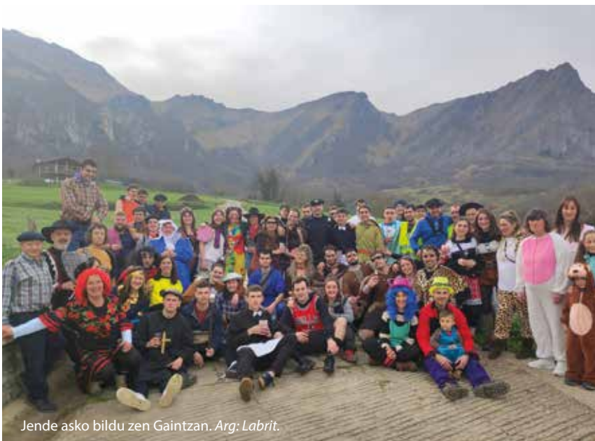
Jende asko bildu zen Gaintzan.