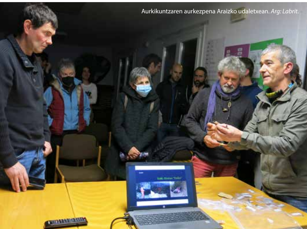
Aurkikuntzaren aurkezpena Araizko udaletxean.