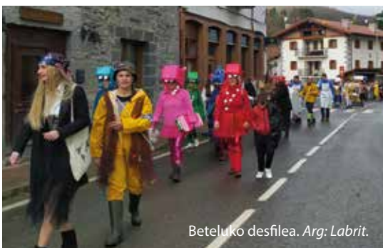
Beteluko desfilea. Arg: Labrit.