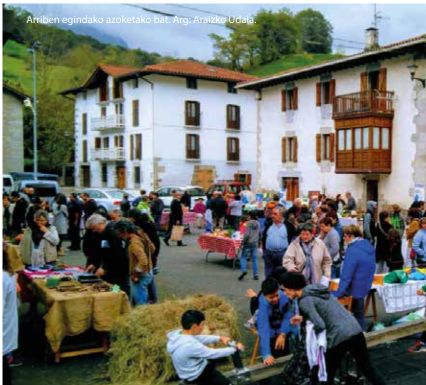
Arriben egindako azoketako bat.

Preso politikoaren eskubideen aldeko egitasmoak ere izan zituzten gogoan, baita Tximuutxe talde feministarekin elkarlanean egindakoak ere. Bukatzeko, mendialdeko