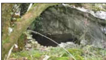
Artizako Izotz Aroko tresnak, mugarri