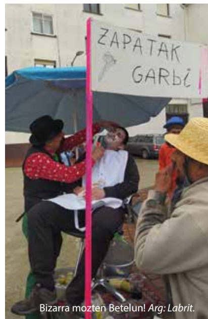
Bizarra mozten Betelun! Arg: Labrit.