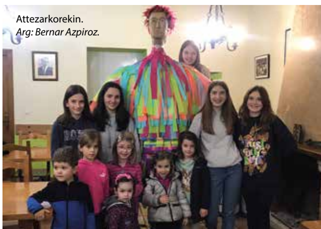
Attezarkorekin. Arg: Bernar Azpiroz.