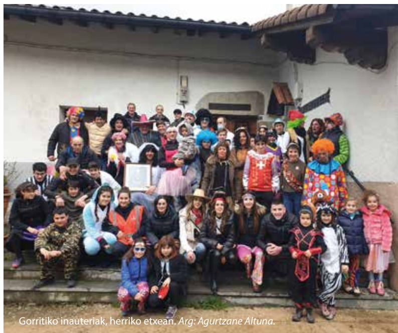
Gorritiko inauteriak, herriko etxean.