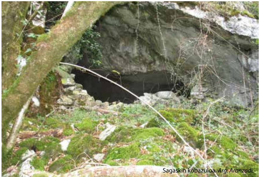
Sagaskin kobazuloa. Arg: Aranzadi.

datazioa zehazteko. Baina lortu dute: “Gutxienez identifikatu ditugu hiru fase okupazional. Ez dakigu zenbateko epekoak izan ziren, baina ez zituzten eserialdiak egiten: Sagaskinen jartzen zuten kanpamentua tarteka, eta joan-etorrian ibili ziren”.