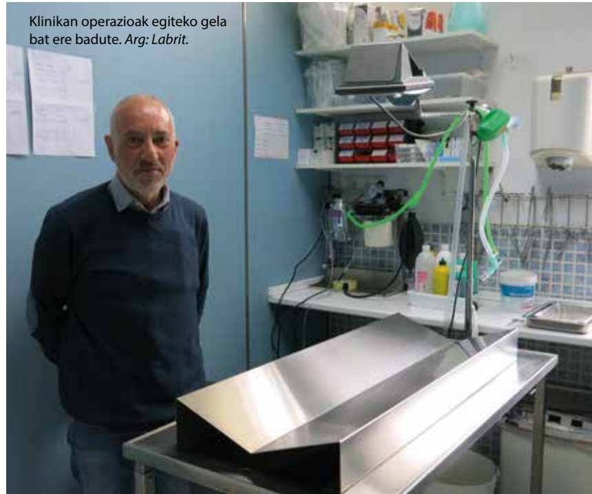
Klinikan operazioak egiteko gela bat ere badute.

Zakurra izan da betidanik jende gehienak izan duen maskota eta guk gehien tratatu duguna. Dena den, aldaketa handia izan da katuarekin. Hemen, gainera, Bulgariatik etorritako jende dezente dago, eta bulgariarrei asko gustatzen zaizkie katuak, zakurrak baino gehiago. Pandemia hasi zenetik, gainera, ikusi dugu katu kopurua izugarri handitu dela. Esan ohi da zakurra zurea dela eta zu katuarena zarela, zeren eta katuak nahi duena egiten du. Abantailak ere baditu: hotzagoa da, aparte egoten da, zuregana joaten da beharra daukanean, eta ez daukanean zure beharrik ez dizu kasurik egiten. Etxe barruan ongi moldatzen denez, ez duzu