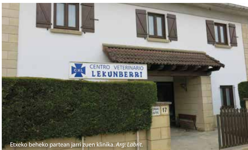
Etxeko beheko partean jarri zuen klinika.

Behiak izugarri gustatu izan zaizkit beti, baita ganaduzalearekin sortzen den harremana ere. Azken urteotan, dena azkarrago doa, eta askoz ganaduzale gutxiago badaude ere, gu geu ere azkarrago bizi gara, presaka. Lehen, gehiago hitz egiten zenuen jendearekin, ordu erdi ematen zenuen denetatik hizketan... Ardiak ere asko gustatu izan zaizkit, baina albatari batentzat lana ez da horren osoa; izan ere, askotan ez du merezi ardi bat tratatzeak, diru kontuengatik. Horregatik, askotan nahiko ohikoak izaten diren arazoengatik