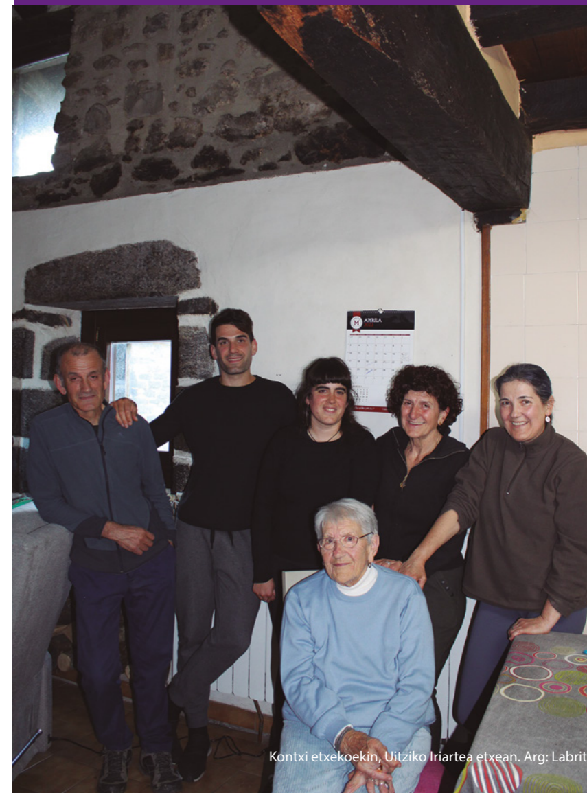
Kontxi etxekoekin, Uitziko Iriarte etxean.

Bizi-bizi bizi da orain, egunetik egunera “hobeki”, baina 1929an jaio zenetik lana gogotik egindakoa da. Beteluko Olanotxiki etxean jaio zen, eta bi anai-arreba ziren. Aita Oderizkoa zuten, argina lanbidez,