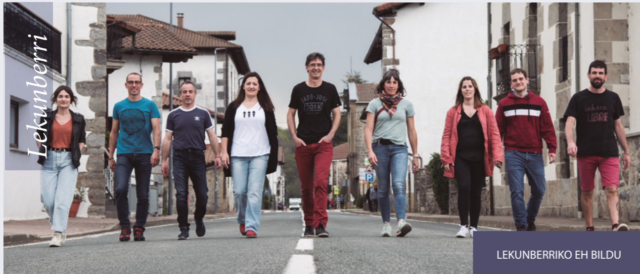
LEKUNBERRIKO EH BILDU